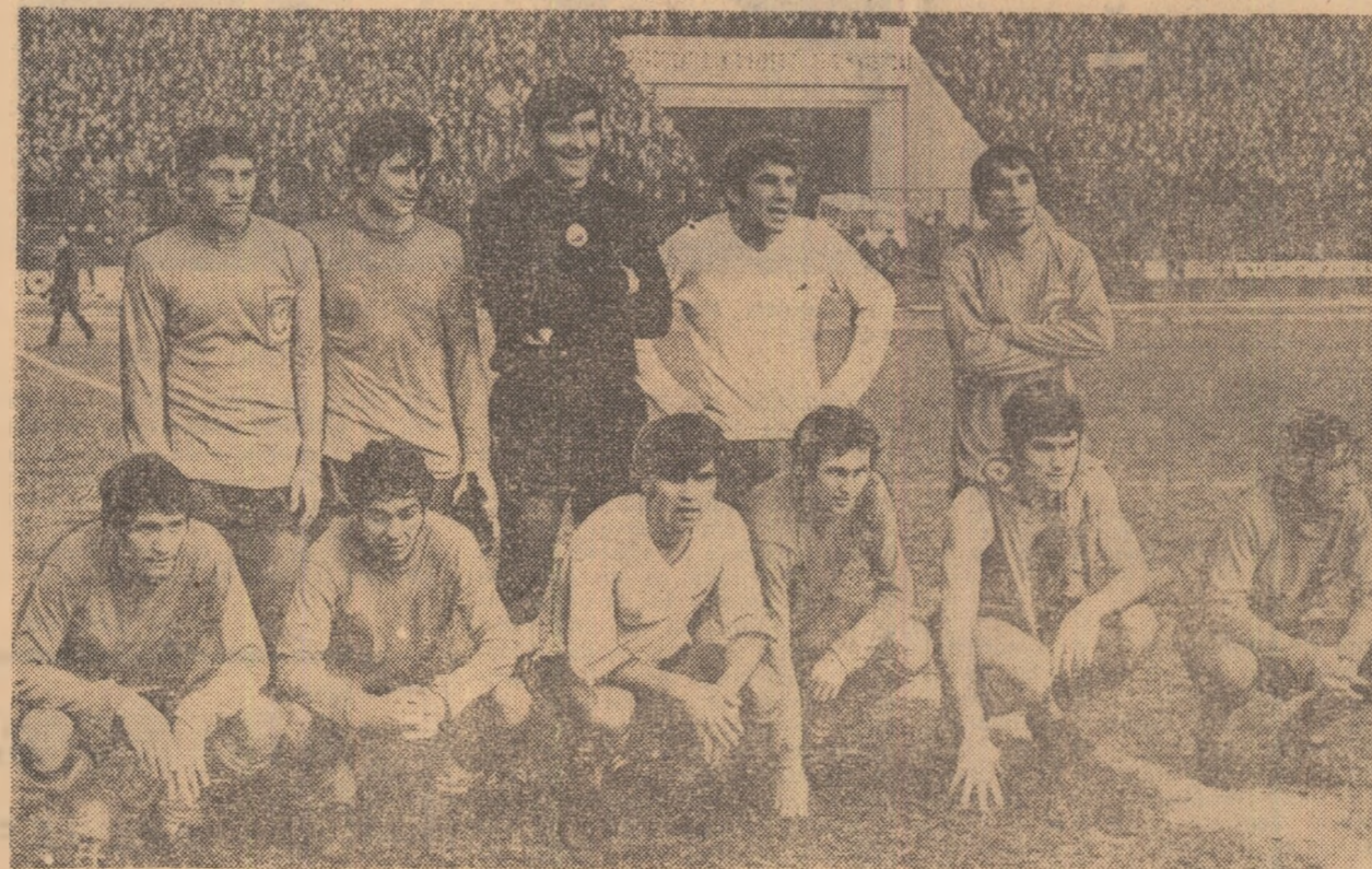
Minutul 91, tradiționala fotografie a învingătorilor crispați încă de efort.

ACEASTĂ POZIȚIE FRUNTAȘĂ CONTINENTALĂ SĂ FIE CONSOLIDATĂ!