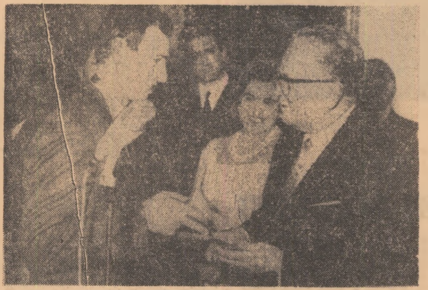
Președintele R.S.F. Iugoslavia, Iosip Broz Tito, îl felicită pe Miroslov Cerar după câștigarea titlului de campion olimpic la cal la J. O. din 1963.