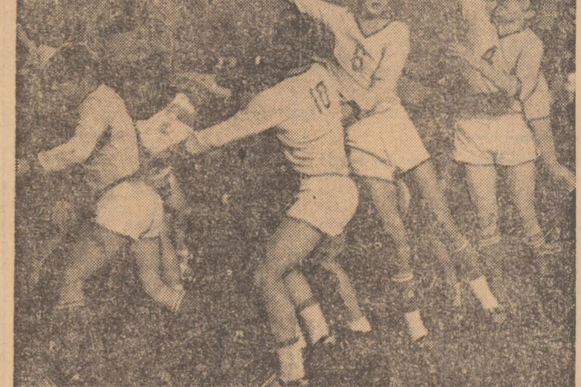
De astă dată, la tuș, au câștigat jucătorii bulgari.

SOFIA, 28 (prin telefon, de la corespondentul nostru). — Al doilea meci dintre hocheiști juniori ai României și Bulgariei s-a încheiat