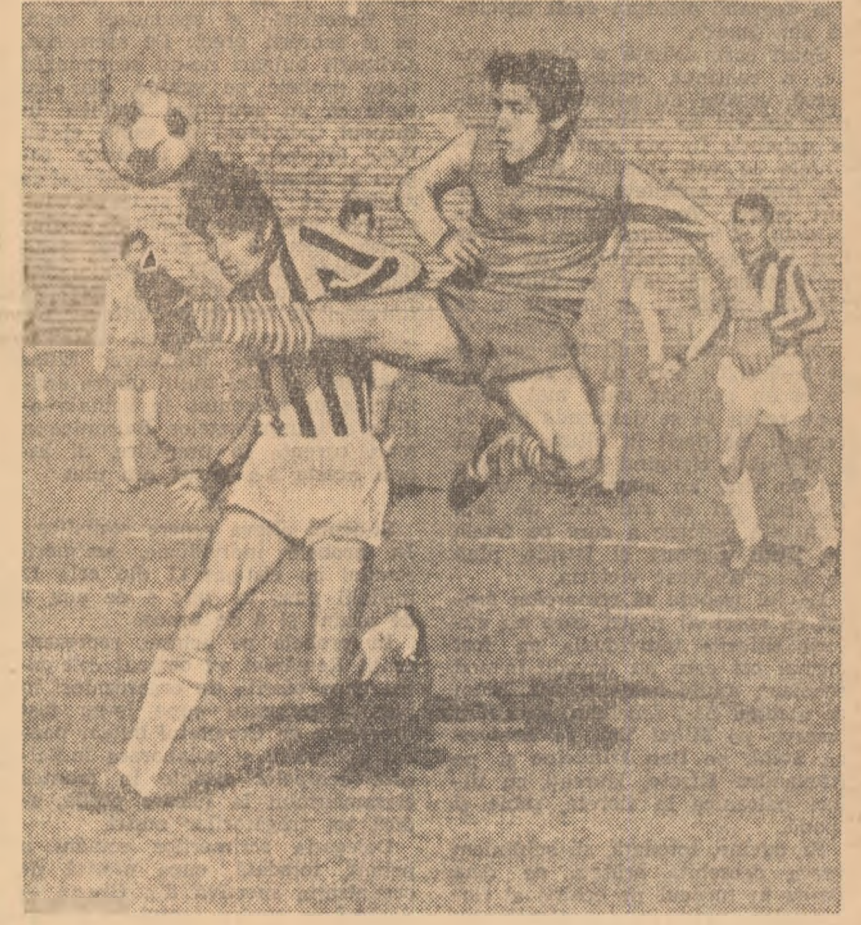
Fază din meciul Electroputere Craiova - Politehnica Timișoara.

Deși craiovenii au dominat în majoritatea timpului, victoria a re-