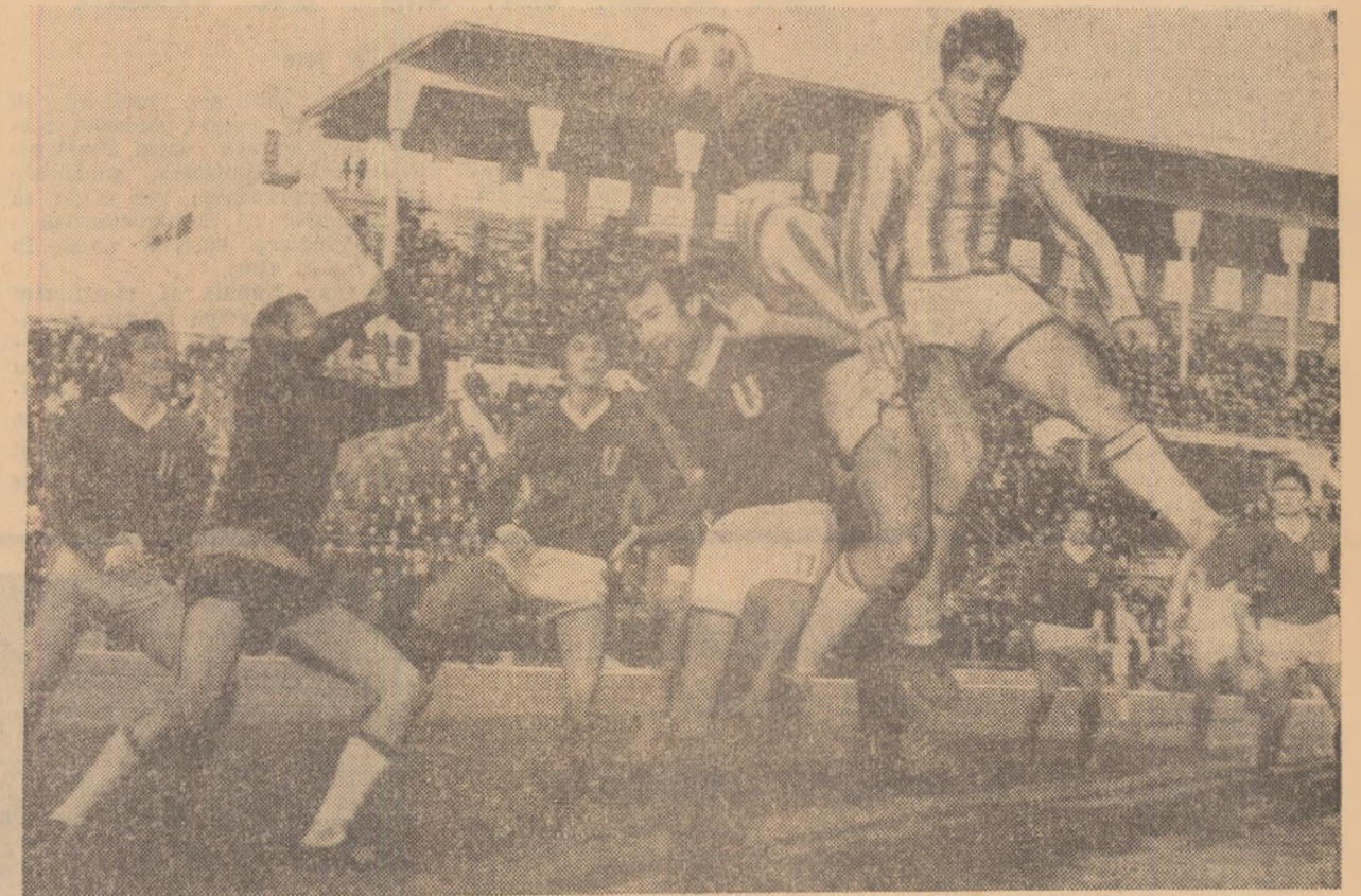
O mostră a încheștării aproape continue dintre apărărea craiovenilor și înaintarea petroliștilor, în revizita secundă a meciului de duminică, de la Ploiești.

puțin 11 echipe (locul 35, Crisul — 7 puncte... locul 6 F.C. Argeș — 12 puncte) au „posibilități” la fel de obiective de a retrograda.