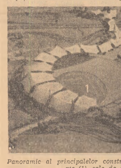
Panoramic al principalelor construcții de la München: stadionul olimpic (1), sala de sport (2) și piscina (3)

● COMITETUL de organizare a J.O. de vară 1972 i-a invitat ca oaspeți de onoare la München și