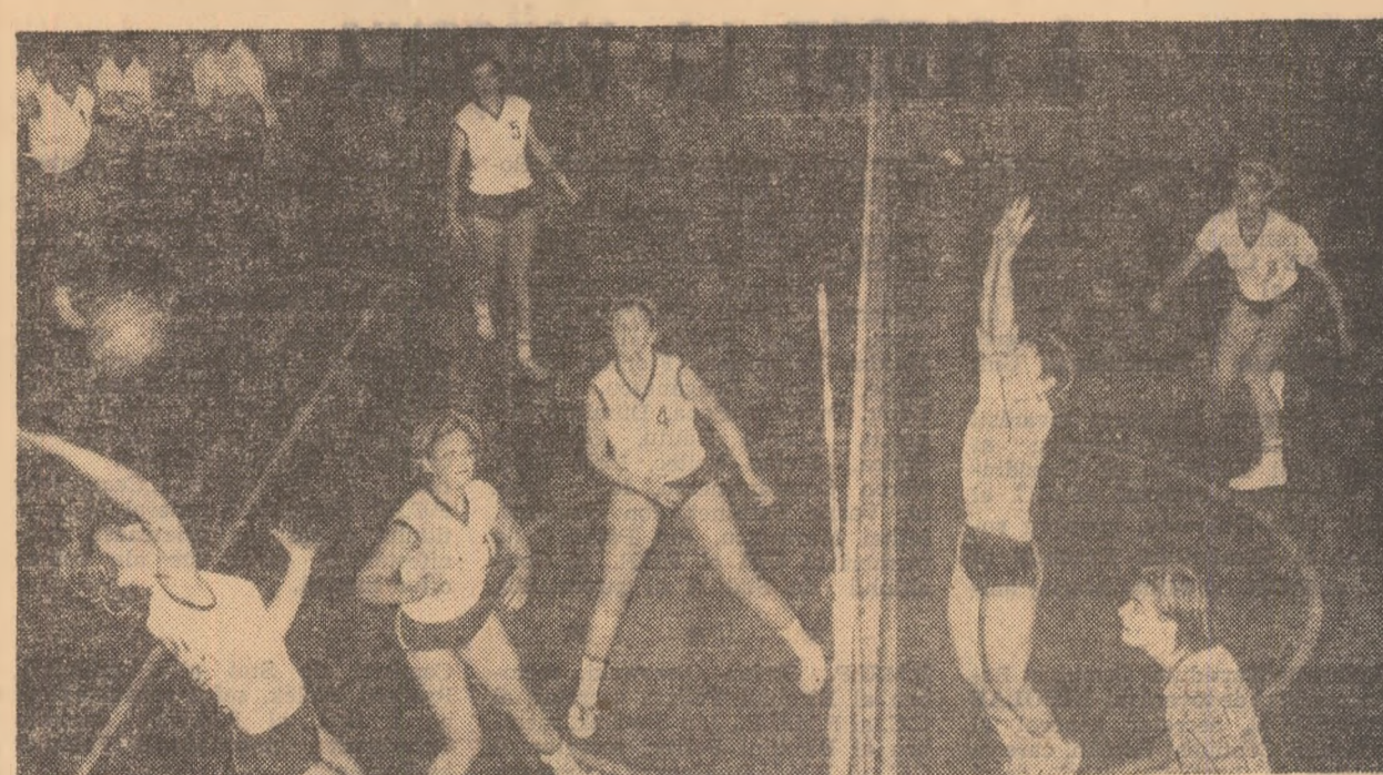
Dispută la fileu. Fază din meciul Medicina București — Penicilina Iași (1—3)

Etapa a IX-a a campionatului feminin s-a consumat fără mari surprize. În derbyul etapei, studențele de la Medicina n-au mai repetat performanța de duminică trecută, fiind întrucute, la București, de campioanele Iași. Iată amănunte de la partidele programate duminică.