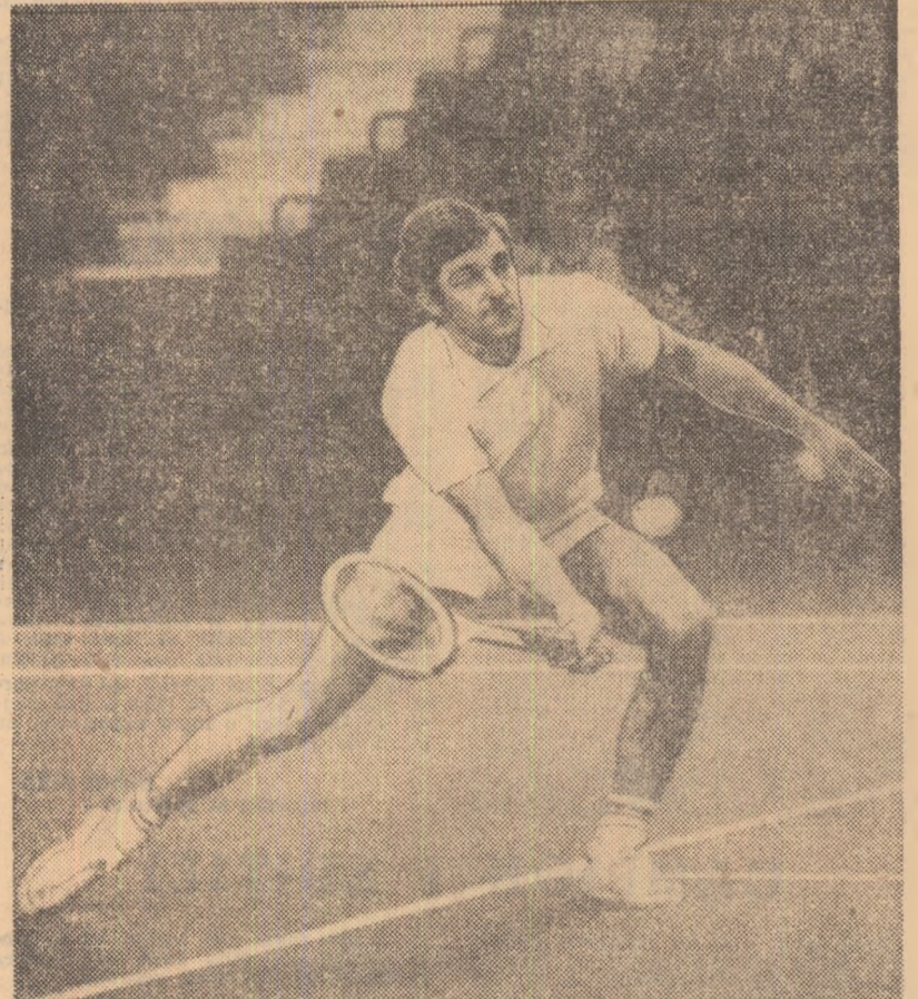
Campionul cehoslovac Jan Kodes — aici în plină acțiune — i-a adus americanului Stan Smith prima înfrînere, în finalul gamei de vineri: 6-4, 3-6, 6-4!