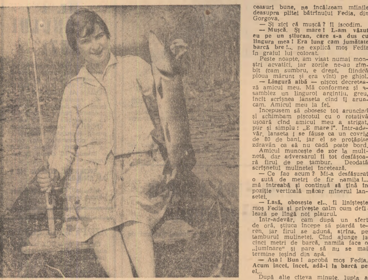
O știucă prezentată în clip de trofeu. Un trofeu care nu lasă indiferent pe nici unul dintre noi, chiar dacă nu este pescar sportiv...