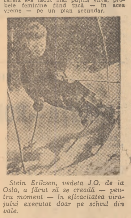
Stein Eriksen, vedeta J.O. de la Oslo, a făcut să se creadă — pentru moment — în eficacitatea vîrșului executat doar pe schiul din vale.