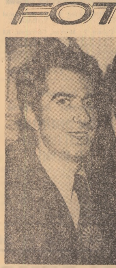
Pele și familia sa au sosit la Paris, fiind invitați de oficialitățile sportive franceze.

ALBANIA: După 10 etape conduce echipa „17 Nendori” urmată de Besa și Partizani.