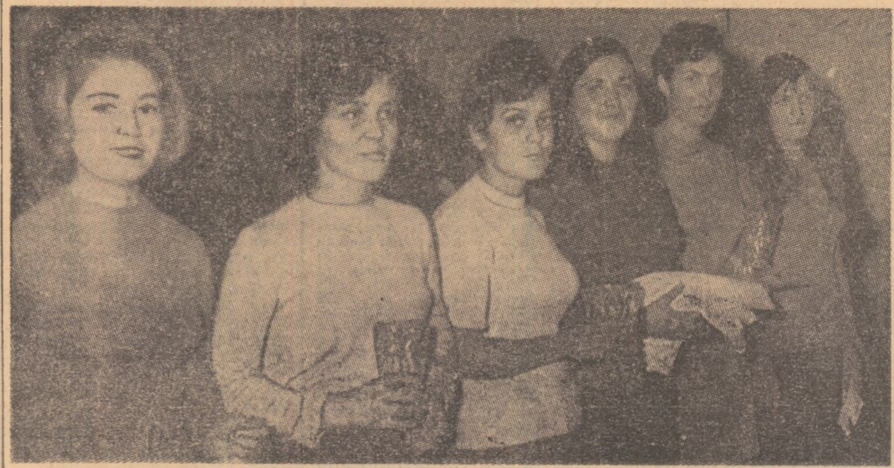
Echipele asociațiilor sportive Dacia, Suceava și Consecția, — primele trei clasate în finala de tir cu arcul, din cadrul „Cupei Diana”

S-au consumat cele patru finale ale întrecerilor incluse în cadrul „Cupei Diana”: cross, fotbal, tenis de masă și tir cu arcul. Deși nu cu rezultate scontate experimentul a avut darul să impulsioneze într-o măsură destul de mare activitatea feminină în acțiunile sportive de masă. Dacă inițial, scopul „Cupei Diana” a fost de a cuprinde un număr mare de salariate din întreprinderile bucureștene în activitatea sportivă, acum se poate spune că desfășurarea ei a redeschis problema angrenării elementului feminin,