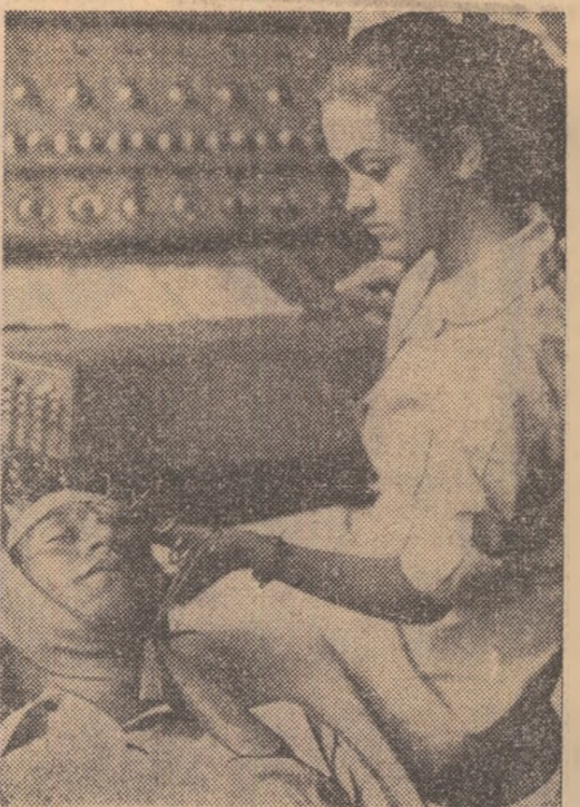
Știința în slujba sportului

Procurați-vă din timp un exemplar de la chioșcurile de ziare și reviste preferate