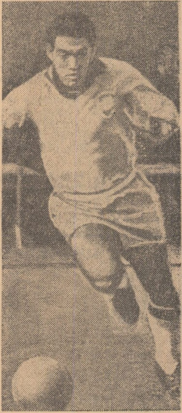
Garrincha își anunță reîntoarcerea...