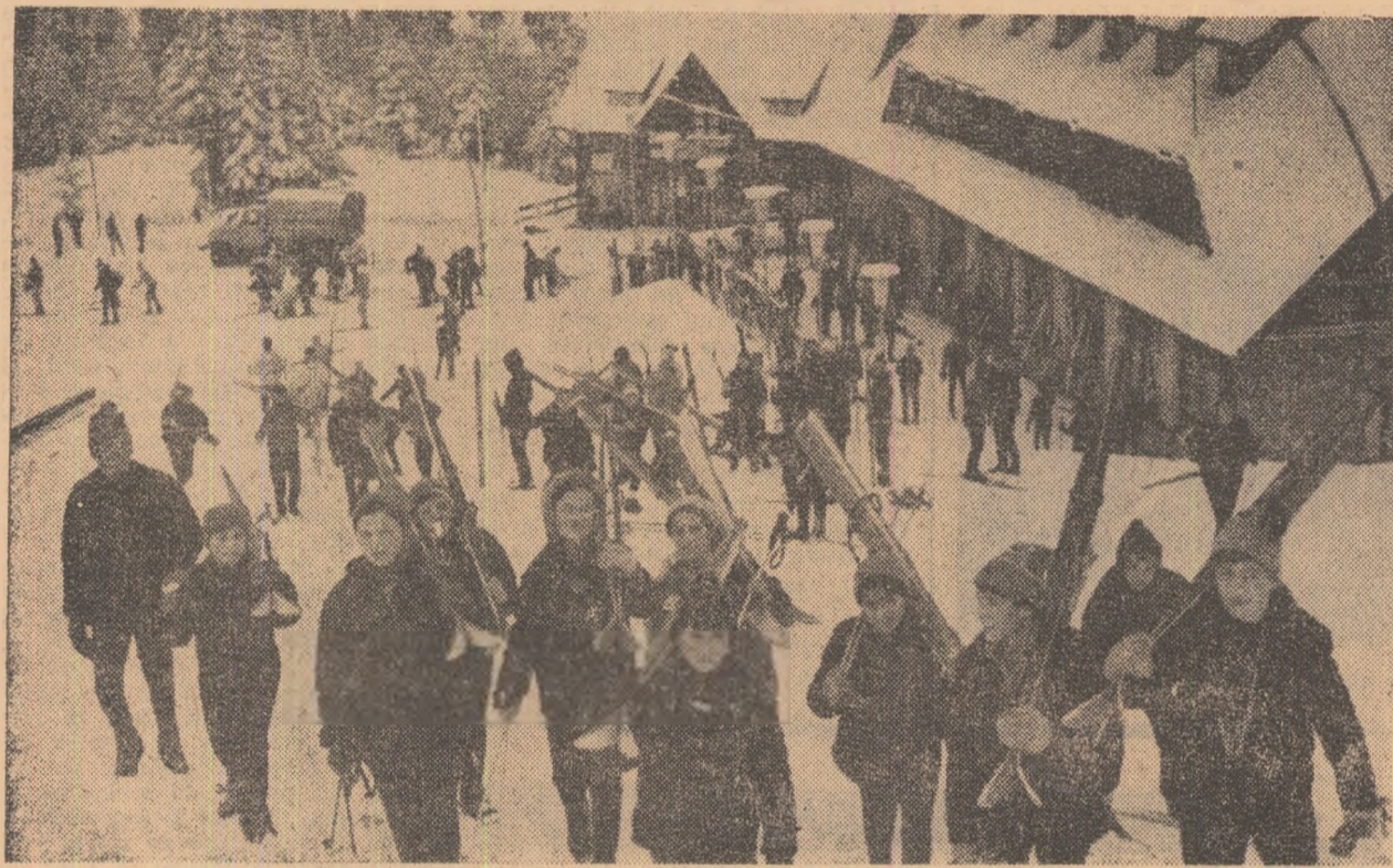
În decor festiv, grupuri de tineri urcă voioși spre vârful muntelui.

Pe marginea consfățuirii anuale în problemele mișcării turistice de tineret