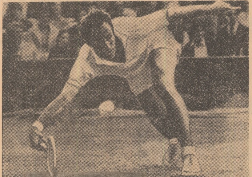
Australianul John Newcombe, la a treia încercare în proba suprenaturală a tenismenilor, turneul de la Wimbledon.

imediat următor. „Veteranul” profesionist Andreș Gimeno trebuie preferat, pentru acea semifinală de la Johannesburg și alte câteva rezultate meritorii obținute în puținele turnee ale W.C.T. Imediat după el se clasează colegul său