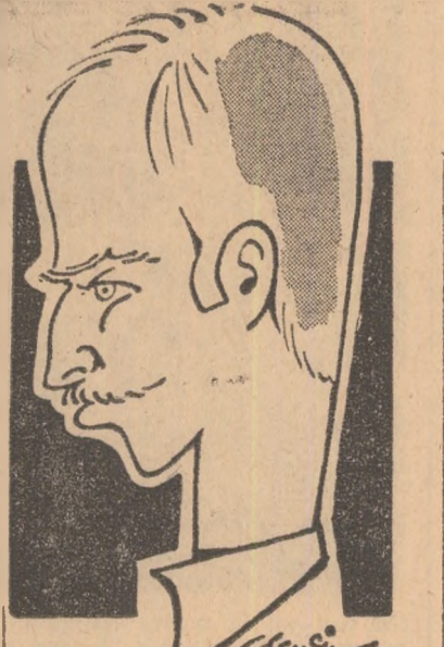
Stan Smith, autorul principal al victoriei americane în finala „Cupei Davis”.

A doua jumătate a tabelului nostru de onoare începe cu campionul cehoslovac Jan Kodes, autorul unor performanțe prestigioase în acest an, printre care se remarcă a doua victorie consecutivă la Roland Garros și calificarea într-o mare finală la Roma. Imediat după Kodes sînt prezente alte două nume celebre. Între profesioniștii Tom Okker și Arthur