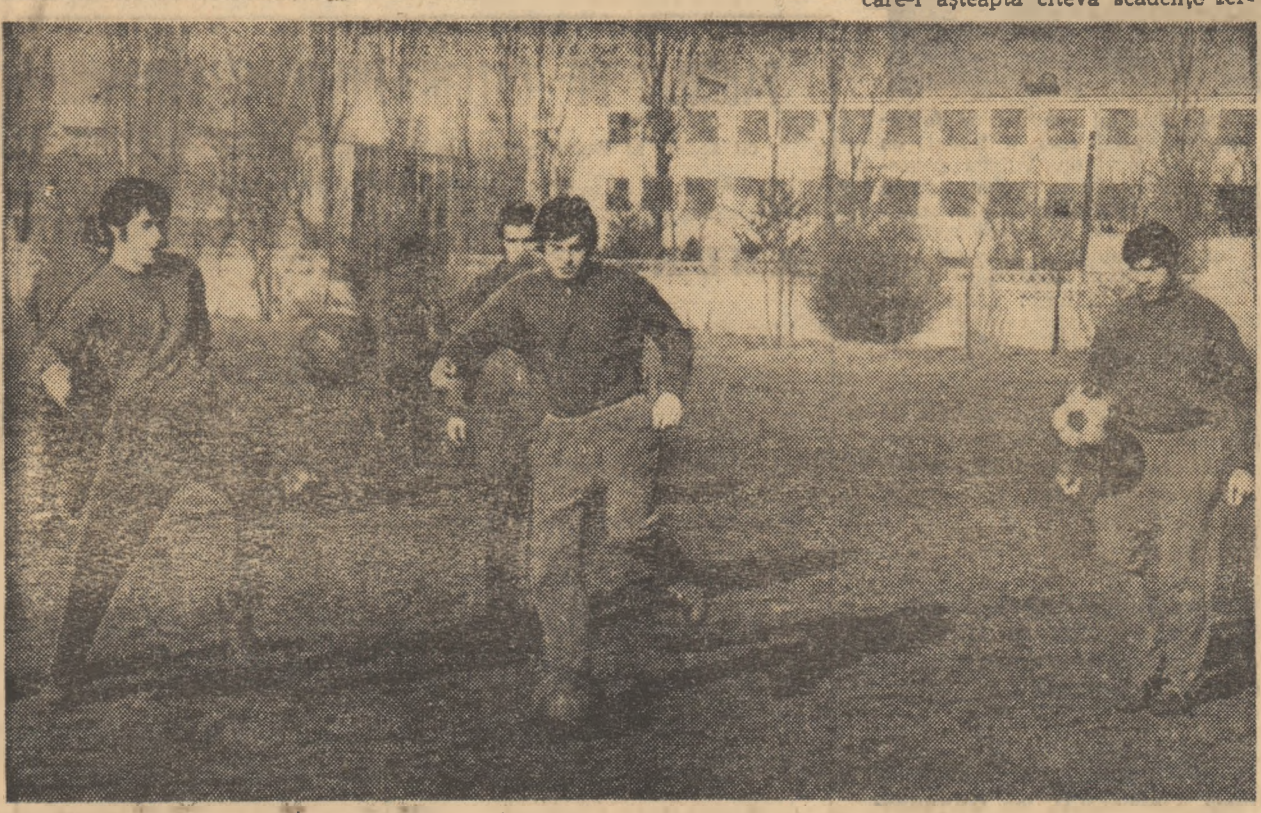
Prima echipă care a început pregătirea a fost Steaua. Secvență de la antrenamentul fotbalistilor bucureșteni.