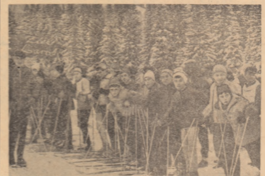
Zăpadă bună pentru schi și sînișus!... Iată marea atu al taberei de la Homorod, într-o vacanță de iarnă în care zăpada s-a cam lăsat așteptată...