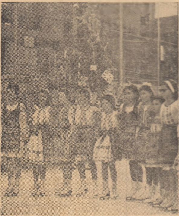
După ce a executat un frumos dans popular românesc, grupul de patinatoare s-a adunat în fața pomului de iarnă. Foto: B. VASILE