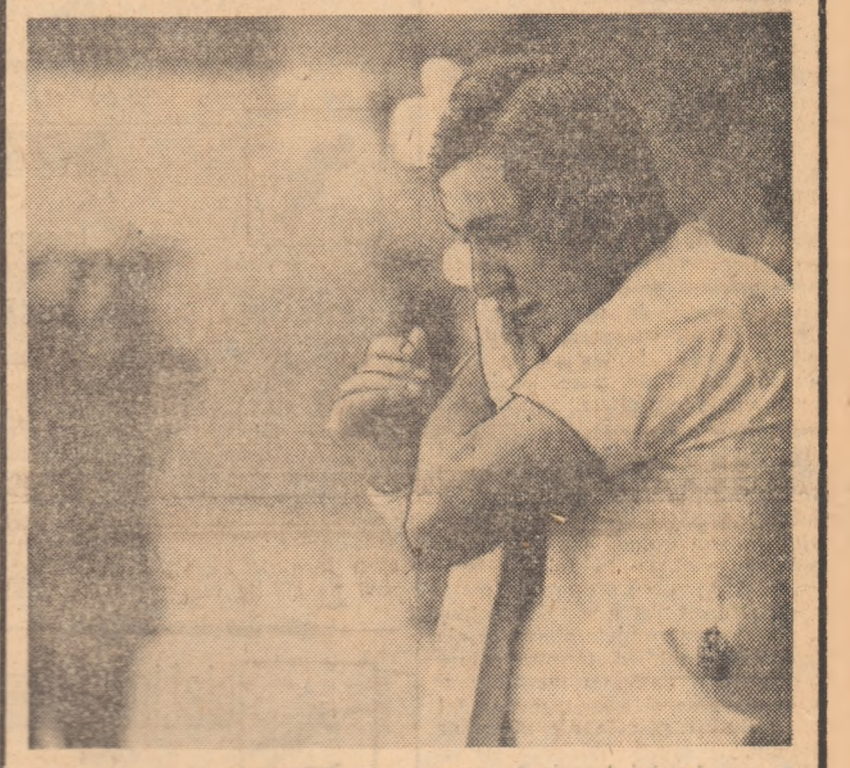
Ilie Năstase a debutat strălucit în noul sezon internațional al ștor rackets. Tenismenul român l-a învins din nou pe cheostovacu Jan Kodes, reușind victoria obținută la Paris, în cadrul „Turneului campionilor”. De data aceasta, Kodes este înfrînt pe teren propriu în fața publicului său. Iată-l pe Ilie Năstase într-o pauză a meciului de la Praga, „un joc de tenis fantastic” — cum l-a caracterizat corespondenții nostru din capitala Cehoslovaciei.