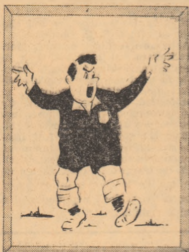
ARBITRUL — Ce fluierați atît? Astăzi dreptul meu, vă rog, fără conștientă!!! Desen de Cornel TABACU

Pe această listă nu figurează o serie de arbitri care ne obișnuiseră cu performanțe bune. Ne gândim, astfel, la V. Dumitrescu. Poate că media realizată (4,33 din șase partide) ar fi de natură, mai degrabă, să ne conducă spre o apreciere favorabilă, dar nu i se poate trece cu vo-