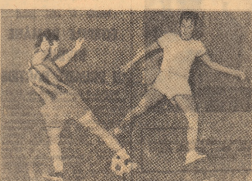
Rakși, în duel cu Sătămăreanu II. Fază din partida de mini-fotbal de ieri. Progresul — Dinamo.