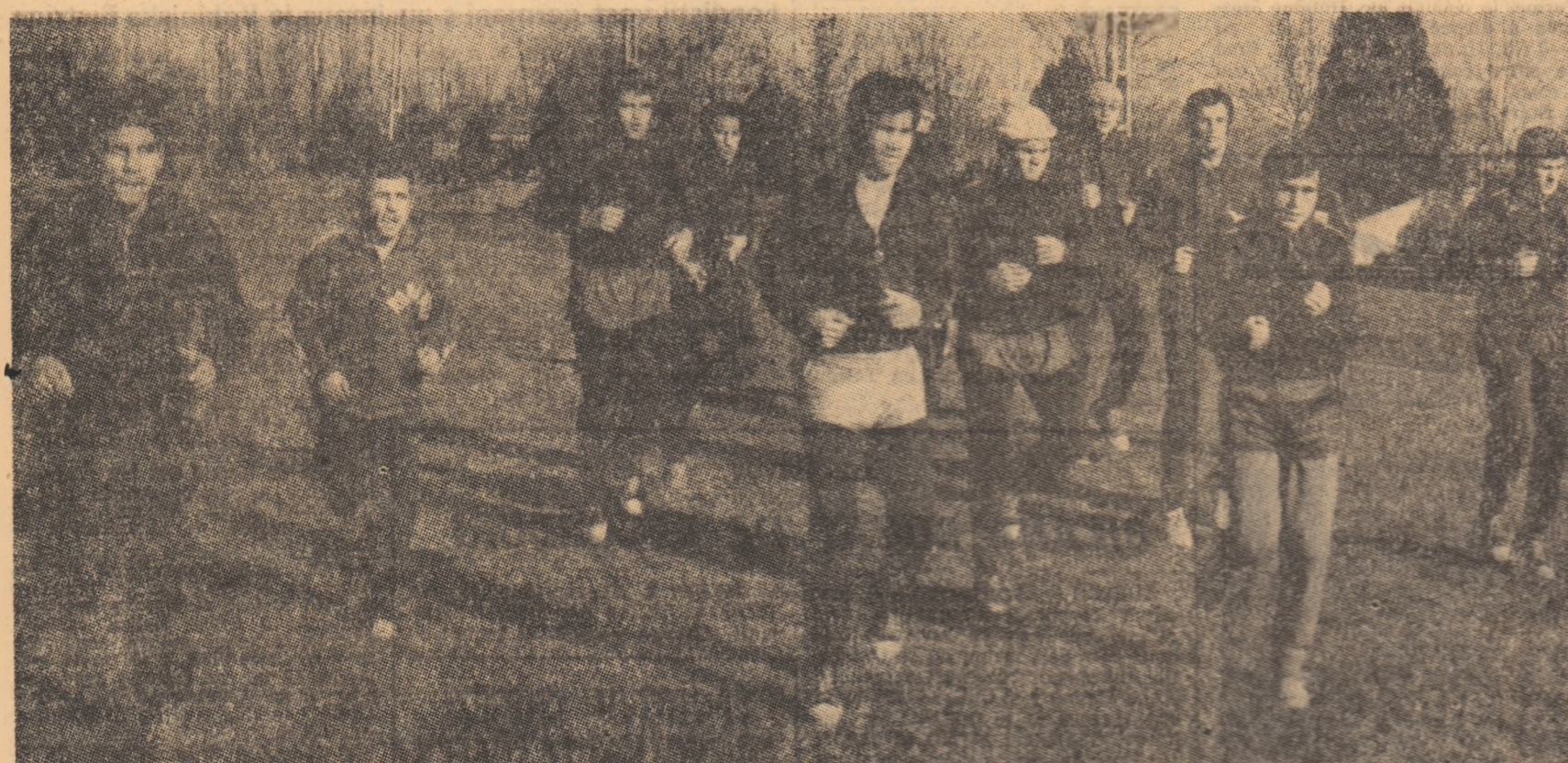
Profundă de vremea blindă, boxerii din lotul național se antrenează în aer liber.

Fond de cîștiguri 281.970 lei. Fișa eligibilității la acest concurs se va face astăzi, în Capitală de la 14 la 18, în fața stației de autobuz nr. 14 în ziua de sîmbătă, 17 ianuarie 1972, în țara de la 18 ianuarie pînă la 24 februarie 1972, inclusiv.