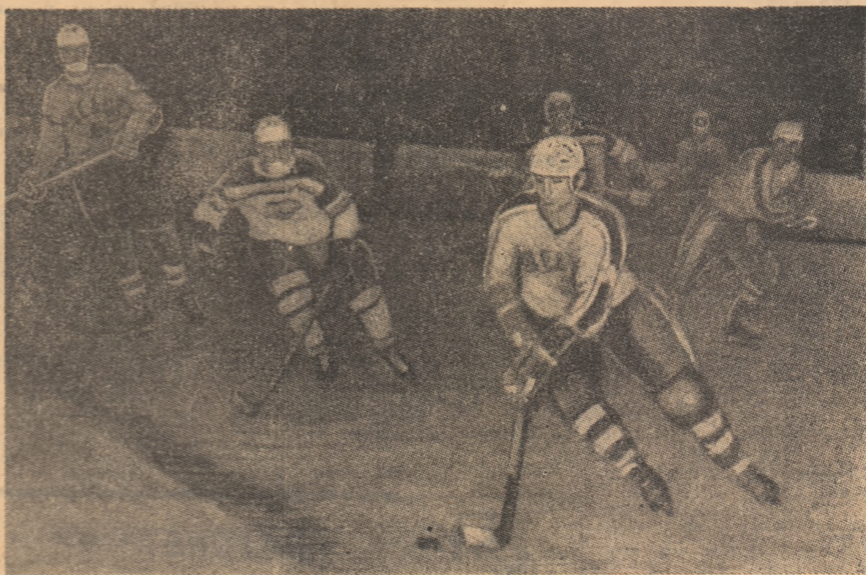
Dinamo — Steua, marele — și din păcate singurul — derby al hocheiului românesc.

După avangarda a doua de formatie din echipa secundă al campionatului național de hochei, astăzi intră în scenă echipele fruntașe, care își vor disputa tururile II și III ale întrecerii pentru titlu. Desigur, atenția amatorilor de sport din Capitală va fi, cu precădere, îndreptată spre tradiționalele derbyuri dintre Dinamo și Steua, totdeauna generatoare de confruntări la cea mai înaltă tensiune emoțională și de o bună calitate tehnică.