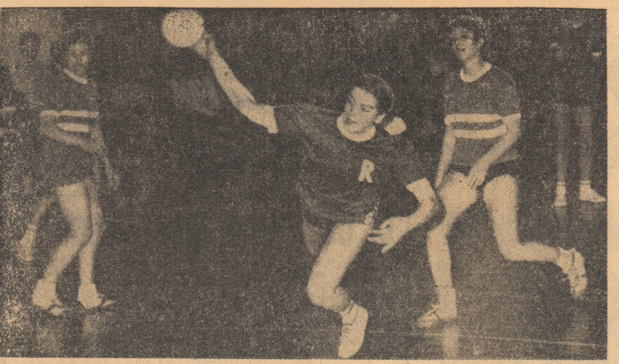
Intrecind pe Ferencvaros cu 15-11