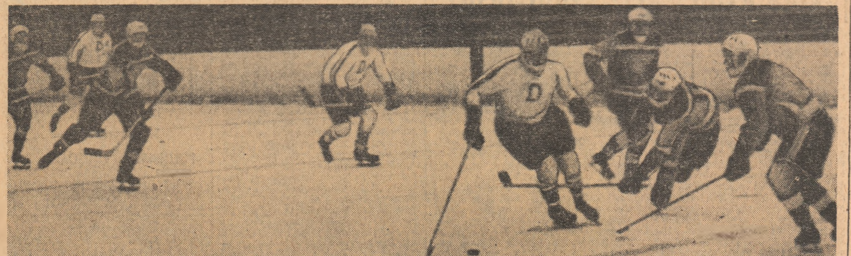
Fază din meciul Dinamo — Agronomia Cluj. Moment de atac al hocheiștilor bucureșteni.