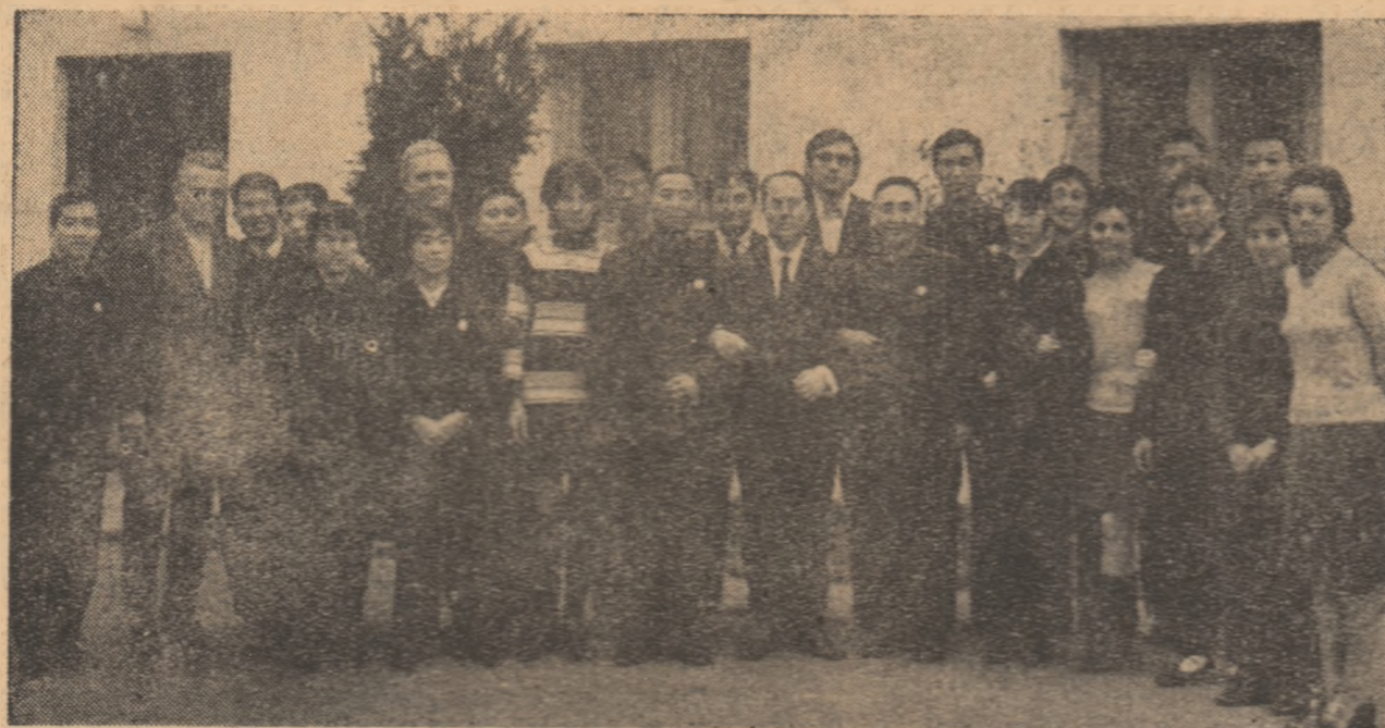
O primă fotografie după sosirea la București a reprezentativilor de tenis de masă ale R.P. Chineze

Primele declarații • Antrenamente comune • Luni, în sala Floreasca: intîlnirile dintre reprezentativele celor două țări