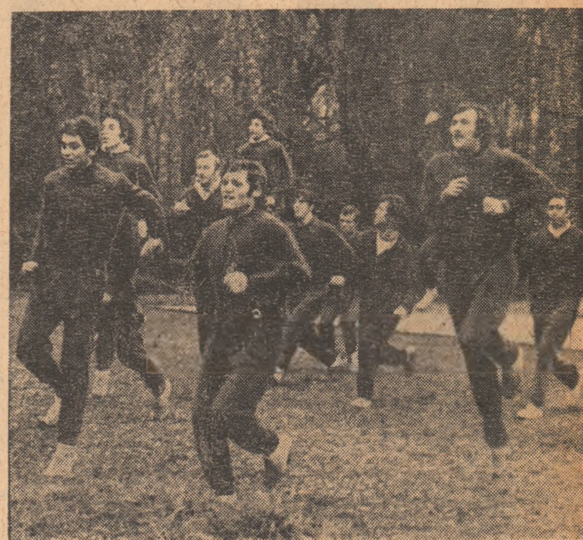
Incet, incet, vacanța a trecut!