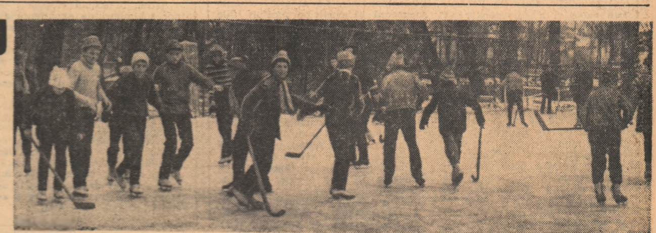
La Palatul Pionierilor patinoarul găzduiește primul meci amical de hochei între începătorii. Deocamdată, însă, se face obișnuită. Încalzire!