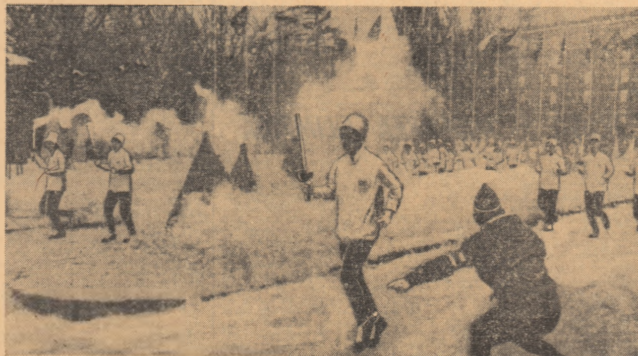
Trei sportivi japonezi purtînd torța olimpică soseser în piața primăriei orașului Sapporo. Fiecare din aceste torțe a străbătut insula Hokkaido pe un drum diferit ajungînd însă în același timp în orașul Olimpiadei albe.

La coborîrile de ieri ale schiorilor francezi, s-a produs un acci-