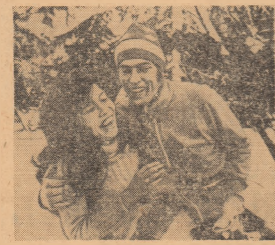
„Olandezul zbuciorător” își savurează victoria...

În cel dintîi clasament al pistei de gheață, 15 secunde și mai bine separă pe primul „olandez zbuciorător” — Schenk, de al doilea — Verkerk. Vreo 20 de centimetri este „diferența de nivel” dintre ei, fiindcă laureatul de la Sapporo este cu un cap mai înalt decât micuțul său rival și prieten Ard Schenk (1,99 m., 87 kg) este tipul ideal al patinatorului de viteză, bun pentru toate probele. Dar a-ona sa impresionantă, asociată tehnicii și rezistenței deosebite îl face imbatabil pe distanțele mari. El n-a ratat medalia olimpică de aur, pe 5000 m, prima care intră în colecția sa de trofee. La Grenoble, cu legea doar argintul probei medii de 1500 m.