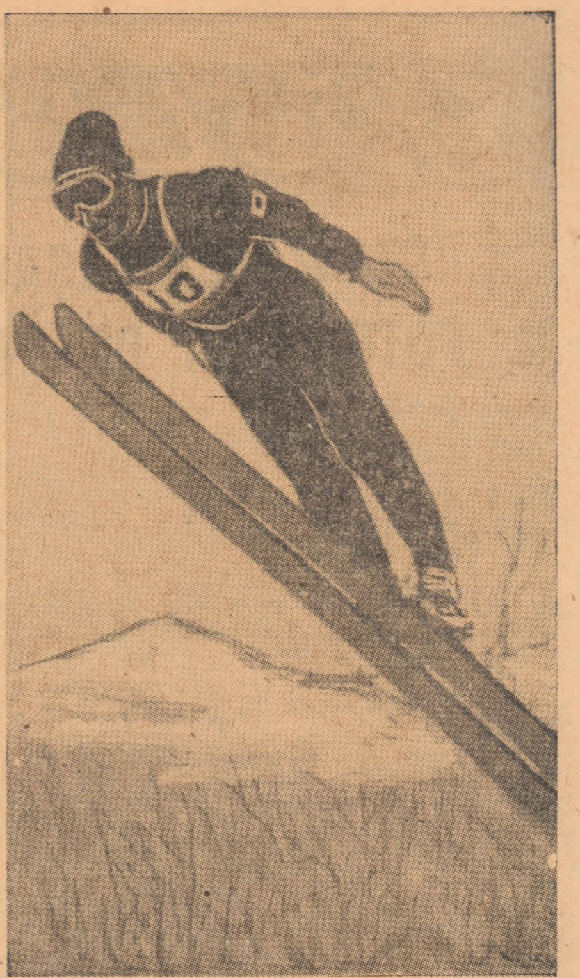
Un tânăr japonez a câștigat săriturile pentru combinata nordică

Iată clasamentul primilor șase: 1. Ard Schenk (Olanda) — 7:23,61; 2. Roar Groenwold (Norvegia) — 7:28,16; 3. Sten Stensen (Norvegia) — 7:33,39; 4. Goran Claesson (Suedia) — 7:36,17; 5. Willy Olsen (Norvegia) — 7:36,47; 6. Kees Verkerk (Olanda) — 7:39,17. După terminarea concursului, Ard Schenk, care savura succesul său, a declarat reporterilor: „Am avut o singură emoție: intrarea în cursă a prietenului și coechipierului meu Verkerk. Numai când am văzut timpul rezultat de el, am putut crede că pot fi campion olimpic. Pista de la Makomanai este excelentă și dacă nu ar fi nins sint convins că aș fi bătut recordul olimpic de care m-am despărțit numai o secundă și 21 de sutimi!”