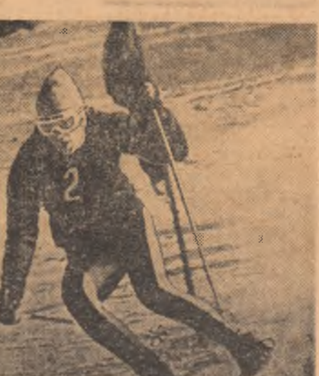
St. Moldoveanu este un tînr schior care bate la porțile afirmării. „Cupa Universității” îi oferă un bun prilej.

Cei mai buni biatloniști juniori din țară își dispută titlurile de campioni naționali simbătă la Poiana Sînaia — Sinaia. Concursurile naționale ale copiilor și-au ales ca loc al întrecerilor Păltinșul (alpine) și Miercurea Ciuc (fond).