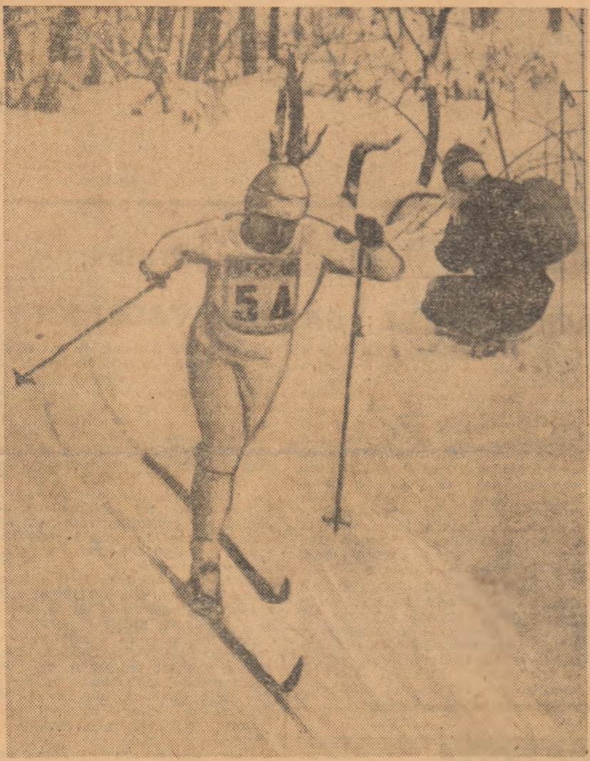
Viceslav Vedenin (U.R.S.S.) se grăbește spre prima medalie olimpică de aur.