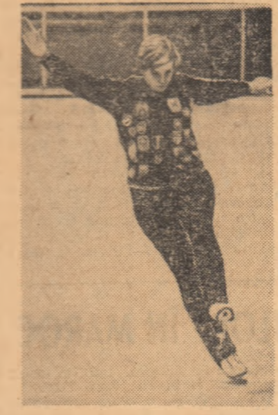
Campiona mondială de patinaj artistic Beatrice Schuba (Austria) execută cu multă grăbi program de figuri impuse stîindu-se, după primele trei figuri, în fruntea clasamentului.

„I speră și campionul mondial, italianul Gaspari, cel ce și-a modificat carena în speranța unor rezultate mai bune care, încă, nu s-au văzut. Oricum, este de așteptat o luptă disperată în ultimele două manșe. De altfel disputa sportivă este grea în toate disciplinele. Numai marile excepții sint la adăpost de surprize ca acest fenomenal olandez Ard Schenk care pare născut pe patine și pentru gheață, sau ca „dublu campion mondial de schi fond, sportivul sovietic Vedenin, micuț ca un japonez dar cu o inimă de fier, care a reușit să învingă coaliția norvegienilor. Mai sint apoi întrecerile nădrăvranelor sănute pe care sportivii din R.D. Germană conduc cu o uimitoare siguranță spre medalii. Marile bătălii sint abia la început. Ne așteaptă, probabil, încă destule surprize, poate și performanțe excepționale printre alii căror autori am dori să-i vedem și pe efyiva dintre sportivii noștri. De exemplu, biatloniștii ne-au aprins speranțele, făcînd un antrenament de tir foarte promițător. Vilmoș cel puțin a tras fără nici o penalizare. Schiorii alpini au continuat și ei pregătirile, Cristea dovedind un progres sensibil.