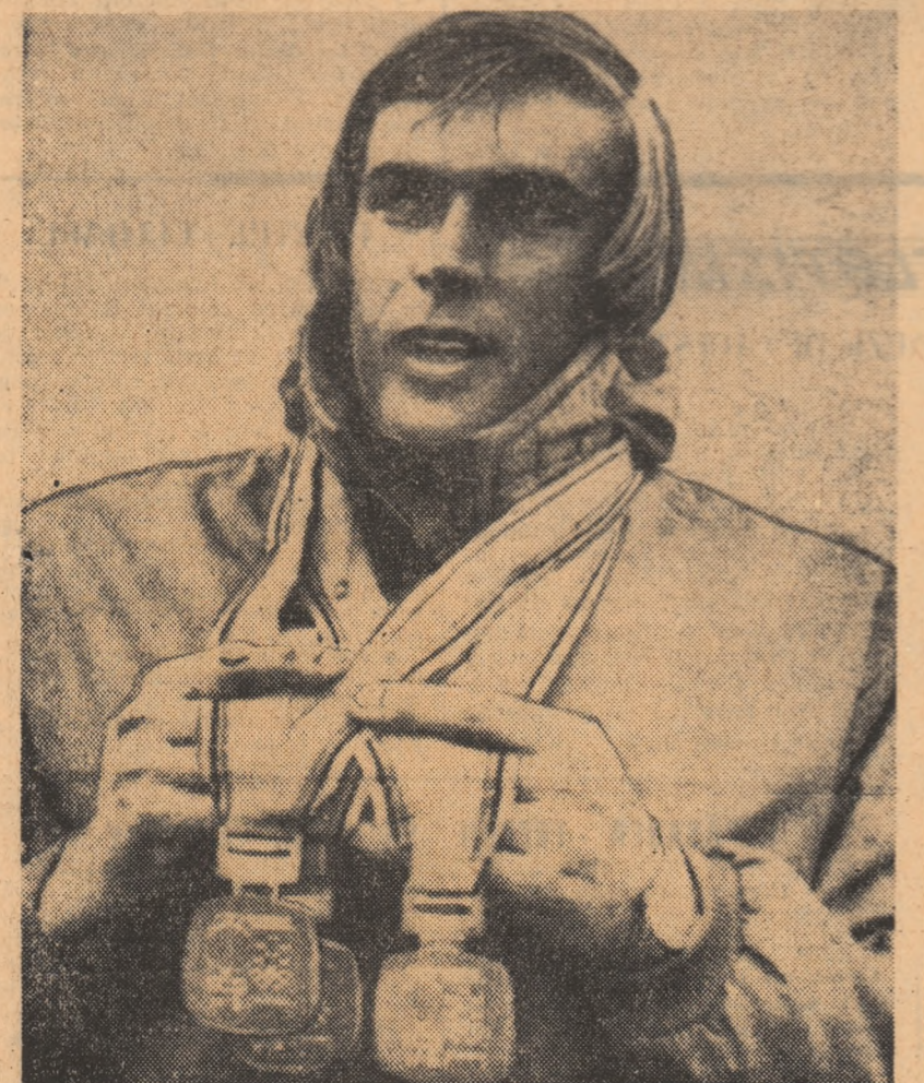
„Gigantul gheții” își poartă mândru cele trei medalii olimpice de aur.