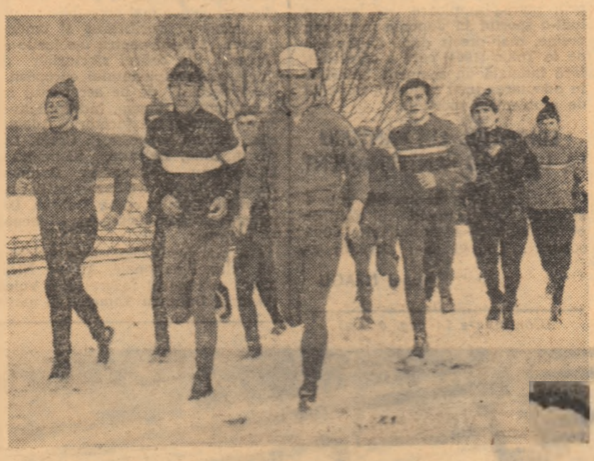
Alte sporturi, printre care și atletismul, sînt chemate să contribuie la buna pregătire a cicliștilor...