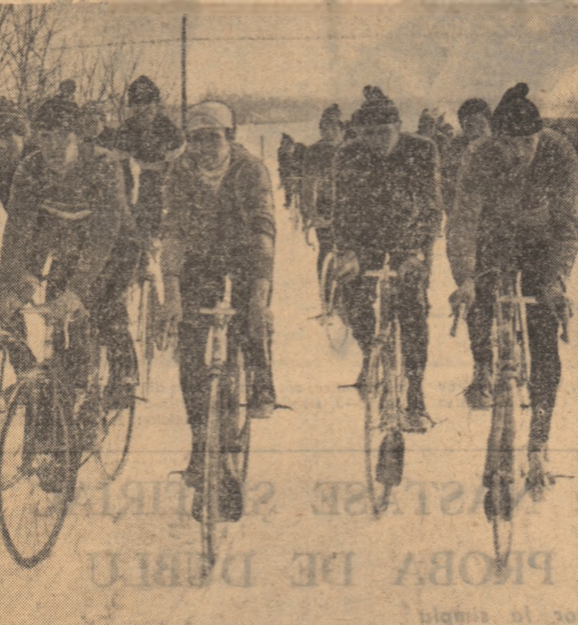
Zăpada s-a așternut în strat gros pe șosea. Rutierii nu dezarmează. Ei știu că cu cât ea va fi mai grea...