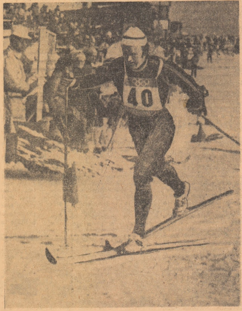
CIȘTIGATORUL CURSEI de 50 km, norvegianul Paal Tyldum, în plină cursă.