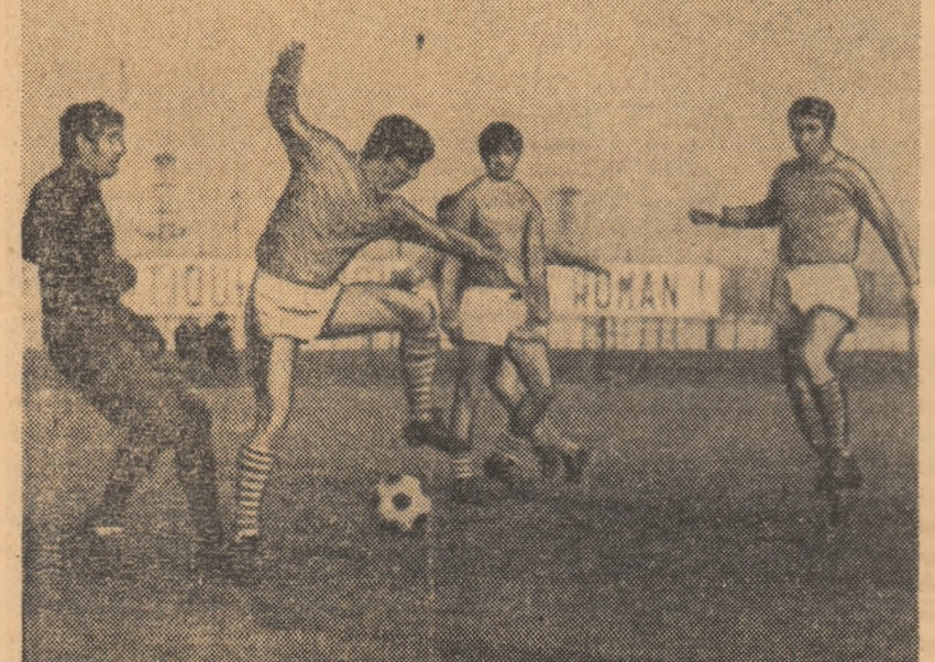
Piteștenii, miercuri, pe stadionul Metalul din Tirgoviște se încălzesc înaintea „amicălitului”.