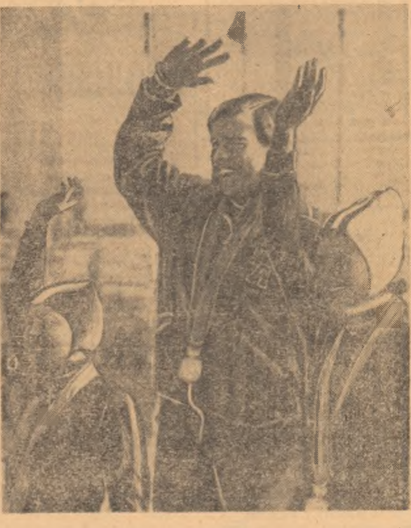
CELE MAI RAPIDE PATINATOARE ale Olimpiadei răspund aplauzelor (de la stînga la dreapta): Vera Krasnova (argint), Ann e Henning (aur), Ludmila Titova (bronz).