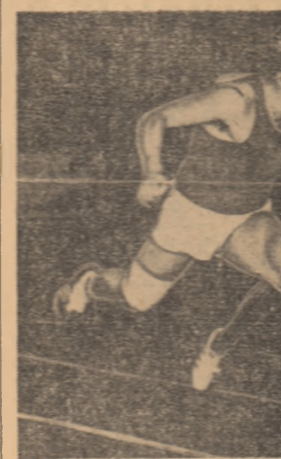
V. Borzov sprintează victorios, în fața americanului de culoare W. Edmondson.

NEW YORK 14 (Agerpres). — În ziua a doua a concursului internațional de atletism de sală de la Los Angeles, cuocucutul recordman american Al Feuerbach a câștigat proba de aruncarea greutății cu performanța de 21:44 m. Pe locul