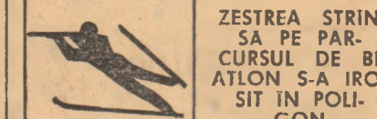
ZESTREA STRINSA PE CURSUL DE BIATLON S-A ÎROȘIT ÎN POLIGON