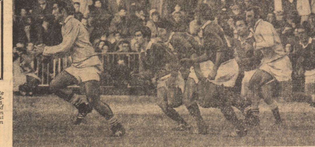
Red.: Este vorba de o echipă de copii și de o echipă de juniori...