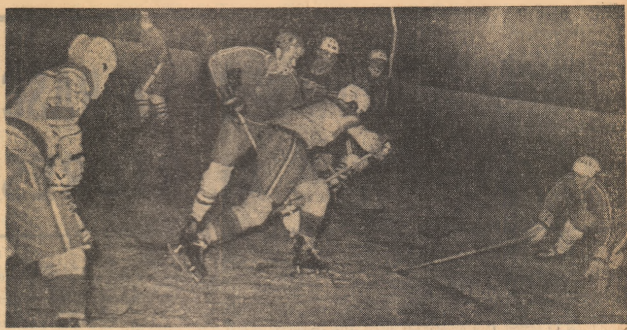
Atac al hocheiștilor bucureșteni respins de apărarea formației budapeștane