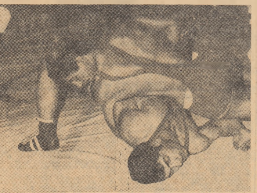
În meciul de lupte greco-romane cu Metalul