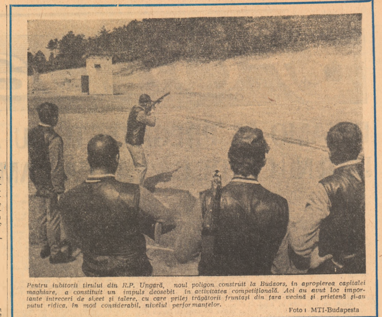
Pentru iubitorii tirului din R.P. Ungară, noul poligon, construit la Budaors, în apropierea capitalei maghiare, a constituit un impuls deosebit în activitatea competițională. Aci au avut loc importante întreceri de șuet și talere, cu care prilej trăgătorii frunțași din țara vecină și prietenii și-au putut încerca, în mod considerabil, nivelul performanțelor.