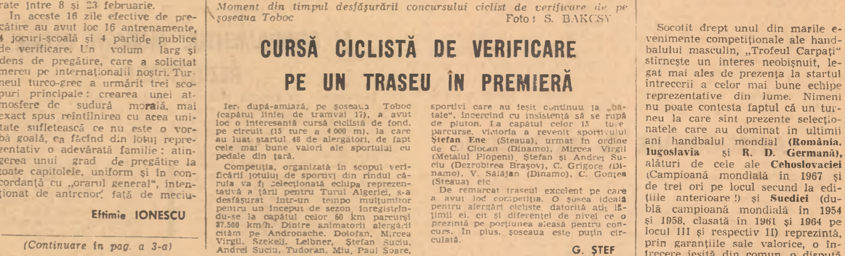
Moment din timpul desfășurării concursului ciclist de verificare de pe șoseaua Toboc.