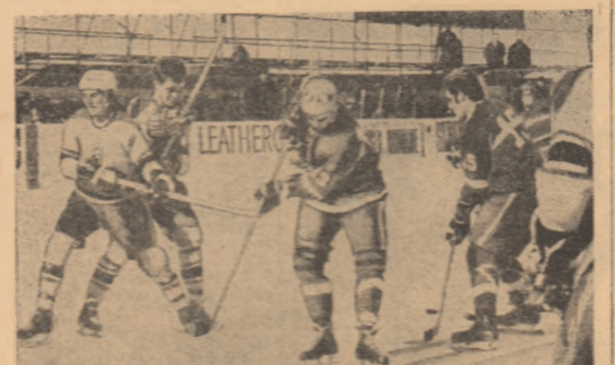
Schneider (13) și Kirchbauer (15) strîngîndu-se după o acțiune din joc. În fața lui Schneider este un jucător al echipei C.M., desfășurată în 1970, în cadrul grupului C și C.M.

Reprezentativa Austriei este o una dintre formații care mai mult prezente la campionatul mondial de hochei pe gheață. Ea a avut, de-a lungul anilor, satisfacții cuceririi, de cîteva ori, a titlului de campion continental (aceasta s-a realizat) și a fost în ultimii ani în jurul său, dar care, la ultimele ediții, a avut o existență destul de zădărnice. Pendulind între grupa B și C.