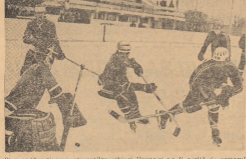
Și această acțiune a atacanților echipei Ungariei ca și oprită de portarul francez Soest. Fără din meciul Ungaria-Franța (2-4) la campionatul de la Galați (grupa C).