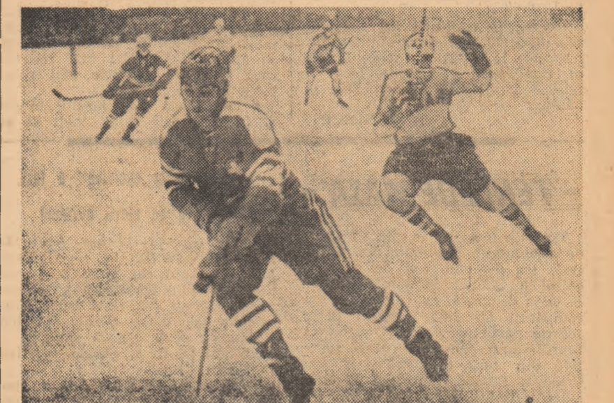
Echipa Elveției evoluează pe gheața patinoarului „23 August”, la ediția bucureșteană a grupei B a campionatului mondial în 1970.

(Citiiți în pagina 4-a prezentarea înfrînirilor de azi și de miine)