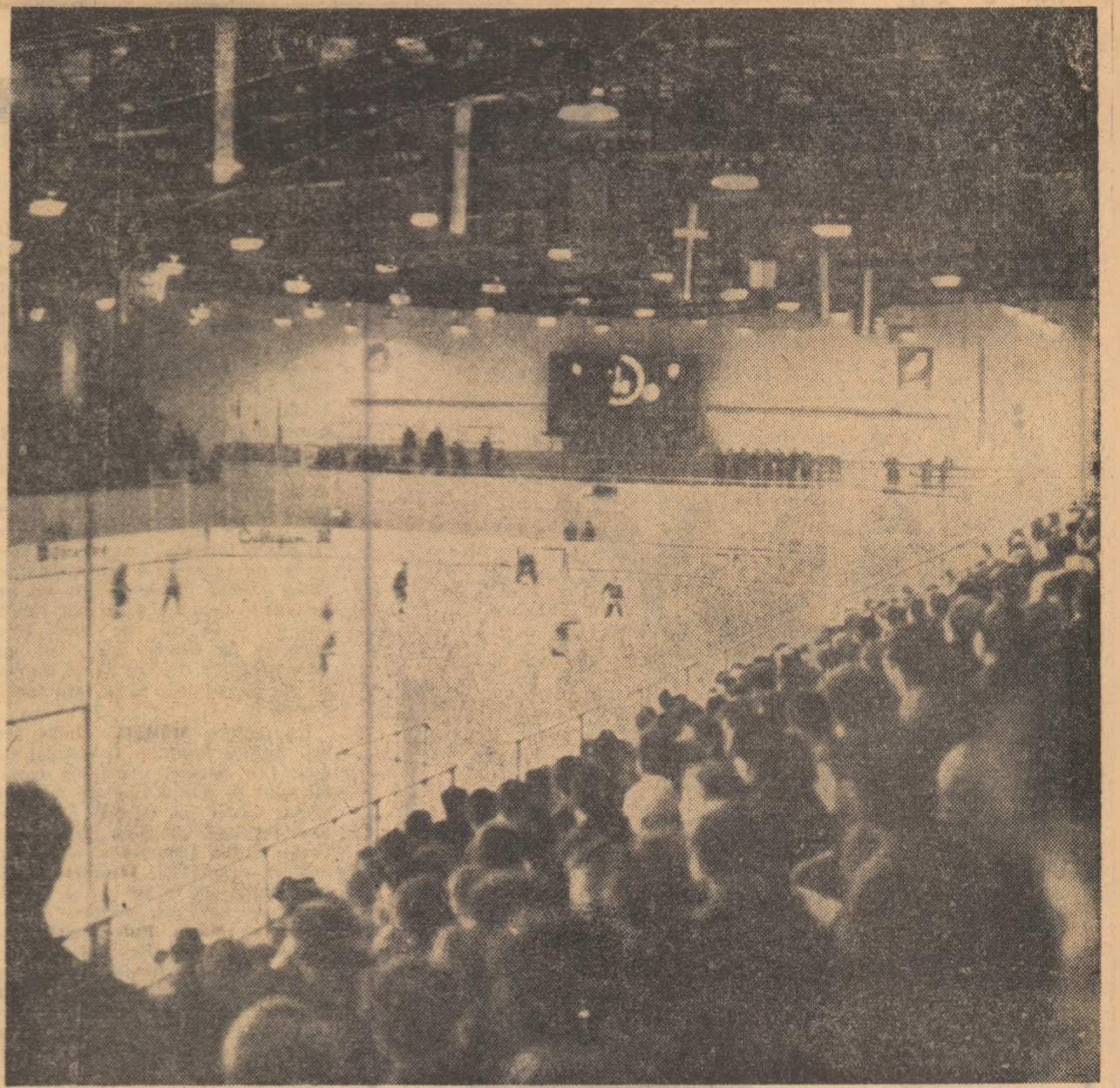
Vederea interioară a noului patinoar artificial acoperit din Miercurea Ciuc

(Citiiți în pagina 4-a, comentariu tehnic consacrat neajptatelor „remize” din prima zi)