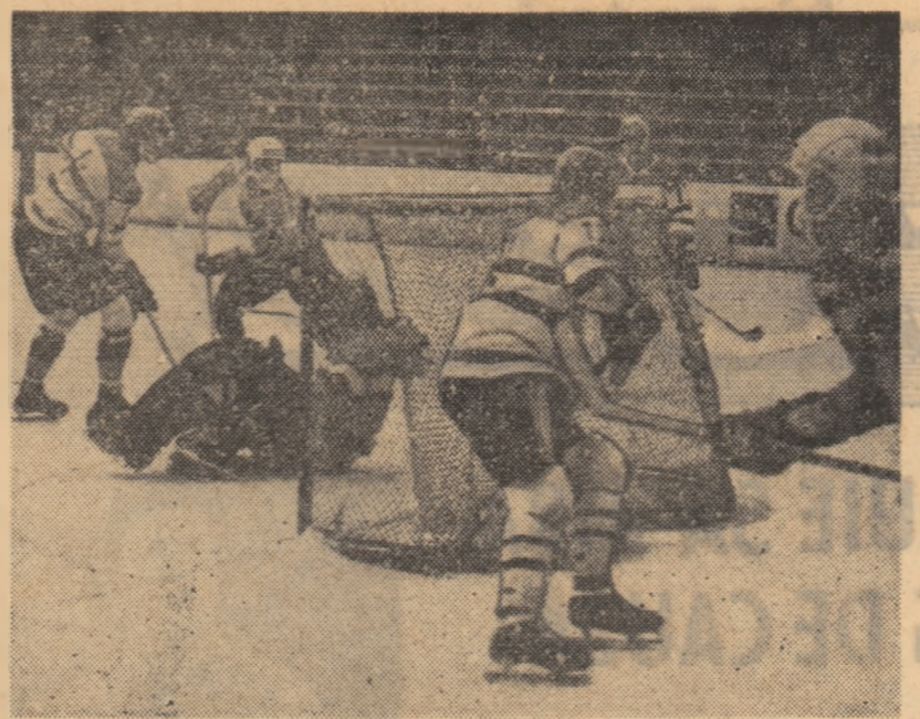
Un spectaculos atac concentric al hocheiștilor români la poarta olandeză.