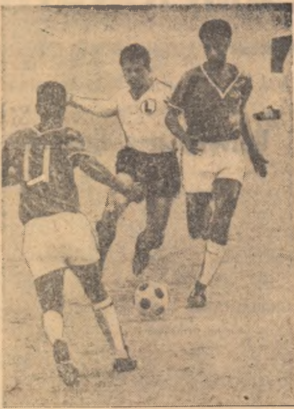
Fotbalul algerian a primit și dezvoltat permanent contactul cu echipele străine, atingînd astfel un nivel tehnic remarcabil. Fotografia înfățișează un moment dintr-o partidă disputată de echipa Sidi-Beï-Abbès în compania Legiei Varșovia.

În deceniul care s-a scurs, multe prefaceri s-au petrecut în viața poporului algerian. S-au înregistrat progrese evidente în toate domeniile, politic, economic, social, cultural. Sportul nu a făcut excepție,