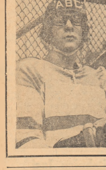
Printre cei 139 de jucători înscrși pe foile de concurs ale grupei C a Campionatului mondial, Jack Deheer, purtătorul tricolorului nr. 8 din echipa Olandei, este singurul hocheist cu ochelari.

Deheer poartă niște „lunete” obișnuite, cu rame cafenii, confecționate din material plastic inelastic și primse pe după cap, cu un elastic. Totuși, citeodată, la ciocniri mai violente ochelarii îi cad de pe ochi. Blondul olandez îi ridică resemnat, li șterge și se avîntă în luptă. De ce l-am ales pe Jack pentru rubrica noastră? Pentru că este „omul de gol” al echipei sale, un jucător care știe să se infiltreze în dispozitivul apărării adverse, marele unghi din situații de-a dreptul incredibile. În încheiere cîteva date personale. Patinează de la 6 ani (acum a împlinit 18). Are 1,86 m înălțime și 77 de kg. Face parte din formația „Trappers” Tîlburg, campiona Olandei. Este elev în ultima clasă de liceu și debutant în echipa națională.