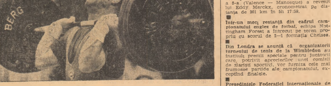
Veteranul echipei de haltere a Ungariei, Imre Földi a avut un start bun în acest an. În concursul internațional de la Urm și a corectat recordul mondial la „limps” cu o performanță de 137,5 kg la categoria cocoș! Un început promițtor înaintea campionatelor europene de la Constanța (13-21 mai) și a J.O. de la München.

IN CLASAMENT conduce acum Honfi și Ungureanu 2 1/2 (1), urmați de Șankovici 2 1/2, Pavlov și Ghițescu 2 (1) etc.