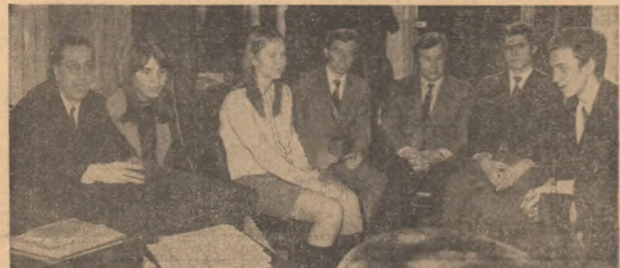
Un aspect din timpul desfășurării mesei rotunde de la redacția noastră