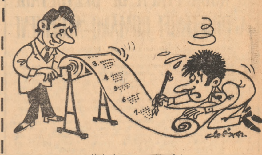
Nici chiar așa, cititorule! Desen de Al. CLENCIU