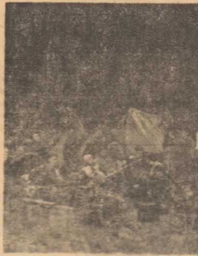
La Baia Mare, primăvara a sosit de... astă toamnă! Excelent prilej, deci, pentru o mini-excursie la șirșit de săptămână.