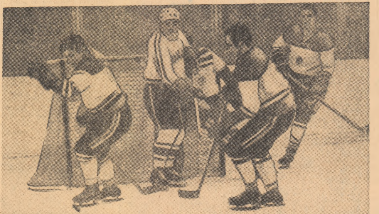
Fază dintr-unul din ultimele meciuri dintre hocheiștii români și iugoslavi. Pană izolat între trei apărători iugoslavi, nu poate fructifica una din ocaziile selecționatelor române.

Cu toate că reprezentativa de hochei a Iugoslaviei s-a clasat pe locul XI (ultimul) la recentul turneu din cadrul Olimpiadei albe de la Sapporo, evoluția jucătorilor noștri nu a fost de natură să nemulțumească pe specialiști. În primul rînd, trebuie avută în vedere valoarea extrem de ridicată a participantelor din grupa B de la Sapporo, și apoi de faptul că la aceste întreceri naționale iugoslava a fost lipsită de aportul citorva dintre cei mai buni jucători, printre care cunoscuții internaționali Gorjanovici, Jug și Rudi Hiti.