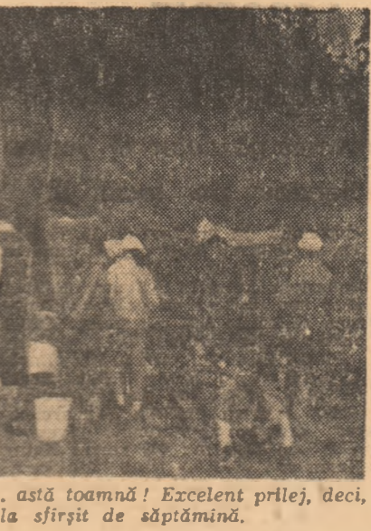
La Baia Mare, primăvara a sosit de... astă toamnă! Excelent prilej, deci, pentru o mini-excursie la șirșit de săptămână.