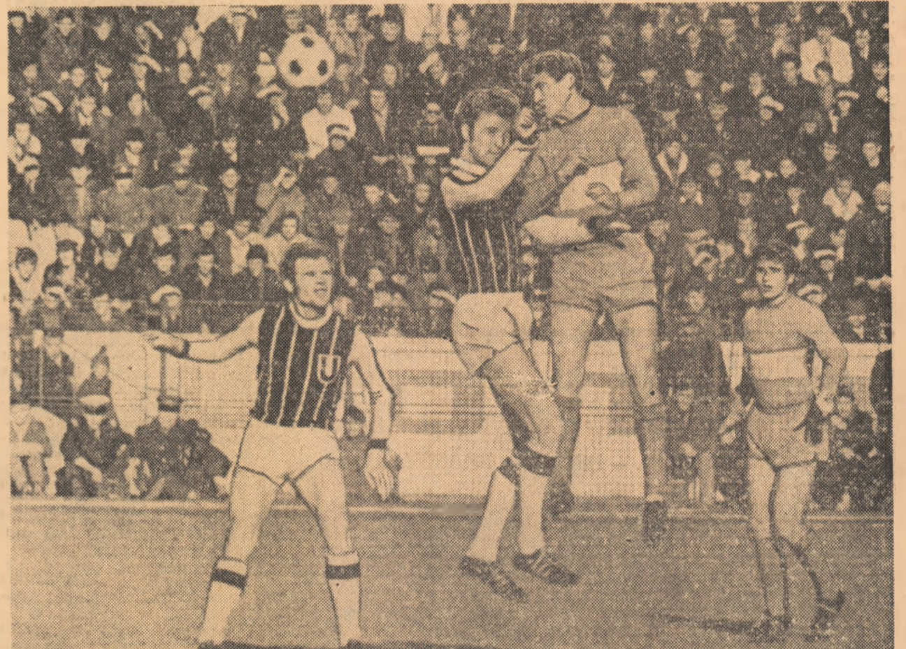
Emoții la poarta studenților clujeni: Războiul a câștigat duelul aerian cu Solomon și va trînte balonul, cu capul, spre poarta lui Moldovan, Urmărește fața, gata de intervenție, Pană și Mihăiță. Secvență din meciul S. C. Bacău — „U” Cluj, disputat duminică și încheiat cu scorul de 1-6 în favoarea gazdelor.

AZI, U.T.A. — TOTTENHAM MIINE, STEUA — BAYERN in sferturile de finală ale Cupelor europene (partide retur) Citiiți în pag. a 4-a rela- țiile trimișilor noștri spe- ciali la Londra și Mün- chen