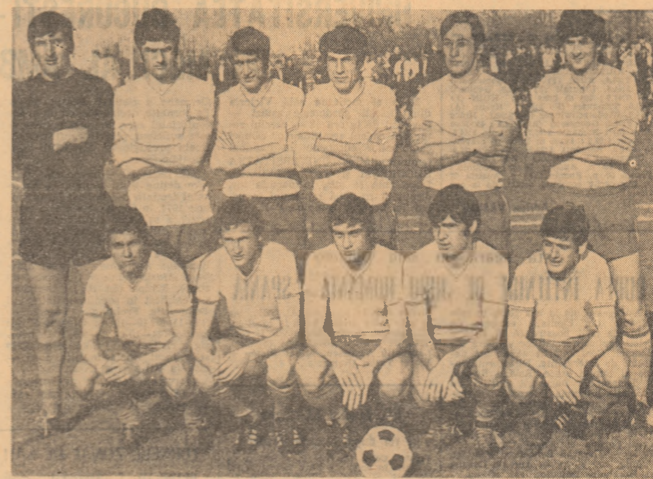
„11“ reprezentativ al României se prezintă înaintea partidei cu Franța

„Afară soarele biruie de tot norii. „Clasa“ tricolorilor, lăsată demult în recreație, și-a reluat parca cu mai multă bună dispoziție ritmul mișcărilor nestăvinite în aerul îmbălsămat de miresmă primăverii.