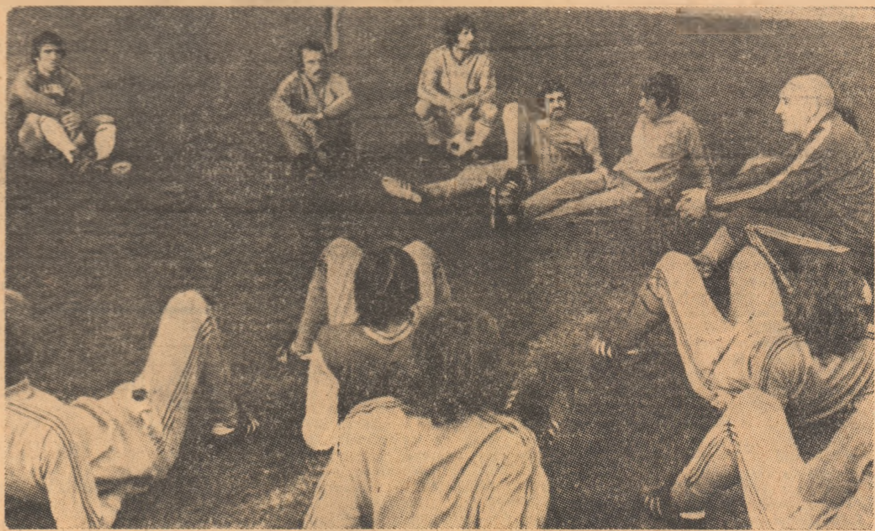
Elerii lui Boulogne, la o scurtă discuție înaintea antrenamentului