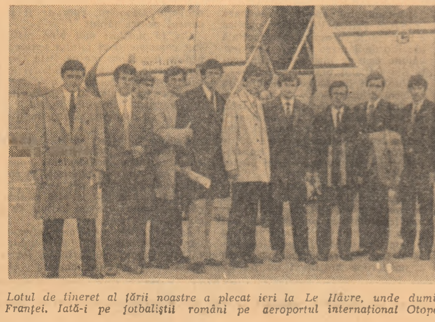
Lotul de tineret al țării noastre a plecat ieri la Le Havre, unde duminică va întîlni echipa similară a Franței, îată-i pe fotbalistii români pe aeroportul internațional Otopeni, înaintea decolării avionului

9.30 (camp. feminin) Luterași — Unirea Tricolorilor; ora 11: Masul Uneltele — T.M.B. (div. C); teren Sirena; ora 9.30 (camp. feminin); Jurelevu — Carmona; ora 11: Sirena — Voința (div. C); teren Giulești, ora 9 (camp. feminin) Rapid — Miorița; ora 13: Rapid — Delta Tulcea (juniori); teren Dinamo; ora 9: Dinamo — S.P. Săd. (juniori); teren „23 August“; ora 9: Steaua — 23 August; ora 9.30 (camp. feminin) Speranta — Tineret; stadionul Progresul, ora 10.30: Progresul — I.F. Tilpas (Suedia) — meci amical internațional. HÂNBAL: Teren Dinamo, de la ora 10.15: Confetia — Voința Odorhei (A.D.); teren Voința, ora 10.15: Voința Buc. — Chimia Buzău (B.D.); ora 11.15: Voința Buc. — Beloniți Săvinești (B.M.); teren Progresul, ora 10.30: Progresul Buc. — Spartac Ploiești (B.D.); teren Tineretului, ora 10.30: I.G.E.X. Buc. — Constructorul Buc. (B.D.). INOV: Baza „23 August“, de la ora 17.30: România — Austria — Franța B. RUGBY: Parcul Copilului, ora 10: Triul România A — România B. SCRIMĂ: Sala Floresca, ora 9.30: Turneu individual (România, Ungaria, Franța, Italia). VOLEI: Sala Dinamo, de la ora 9.30: Medicina București — Rapid (A.D.); Dinamo — Penicilina Iași (A.D.).