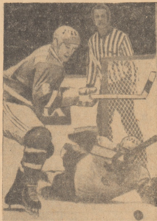
Portarul suedez, presat de un atacant cehoslovac, respinge cu dificultate pucul. Faza din meciul Cehoslovacia — Suedia.

Teri după-amiază, în primul meci al programului reprezentativ al Cehoslovaciei a realizat și cea de a treia victorie consecutivă, surclasînd pur și simplu formația R.F. a Germaniei: 8-1 (1-1, 2-0, 5-0). La ora cînd încheie ediția este în curs de desfășurare partida dintre echipele U.R.S.S. și Elveției.