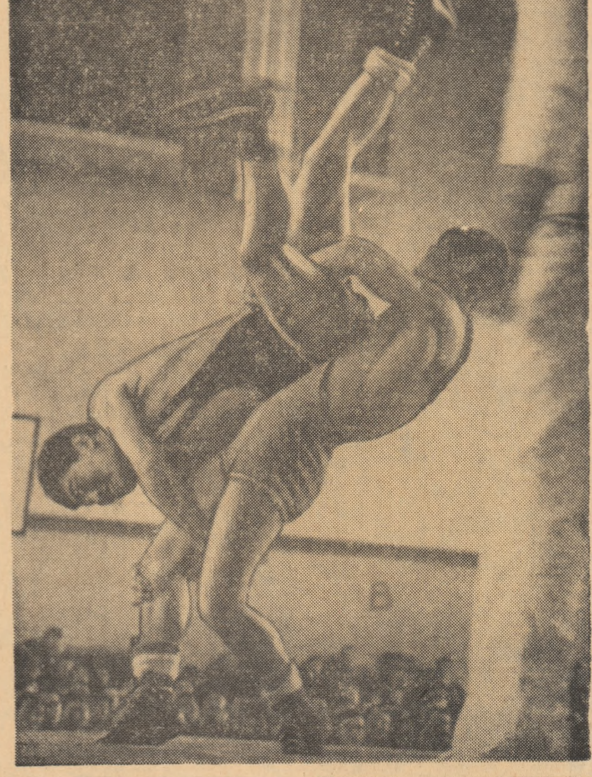
Recent, s-au desfășurat la Ulan-Bator însoțirea unui interesant concurs internațional de lupte libere, cu participarea sportivilor din R. P. Bulgaria, R. S. Cehoslovacă, R. D. Germană și R. P. Mongolia. De un deosebit succes s-a bucurat evoluția reprezentanților țării gazdă, care au cucerit în total 7 medali de aur, 5 de argint și 5 bronz. În fotografie: o spectaculoasă fază din întâlnirea a doi luptători mongoli.

Evoctuindu-se succesele pe plan internațional, s-a vorbit despre me-