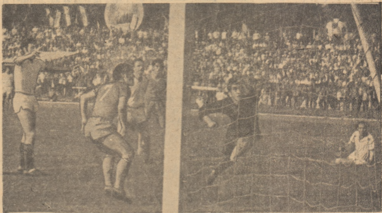
Secvență de la partida Dinamo-Universitatea Craiova...