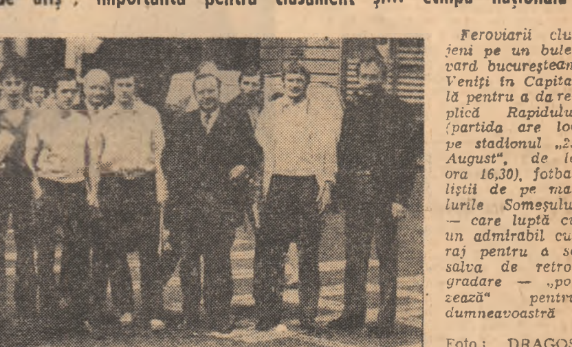
Feroviarul clujești pe un bulevard bucureștean. Veniți în Capitală pentru a da repede Rapidului (partida are loc pe stadionul „23 August”, de la ora 16,30) fotbalisții de pe marile Soselele — care luptă cu un admnabil curaj pentru a se salva de retrogradare — „pozează” pentru dumneavoastră.

O etapă cu multe „capete de afiș”, importantă pentru clasament și... echipa națională