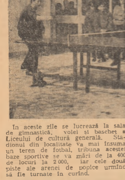
PEISAJ SPORTIV INEDIT LA SLOBOZIA