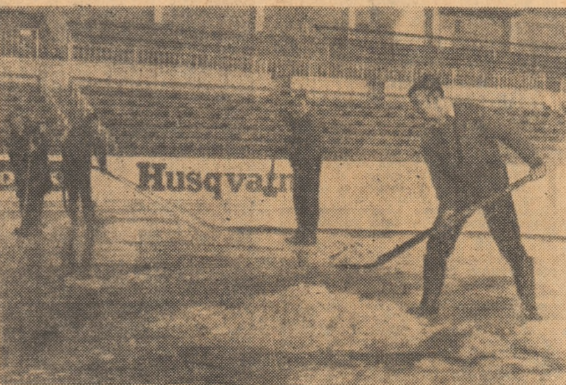
Pe patinoarul artificial „23 August” se curăță gheața și va urma montarea ringului de box