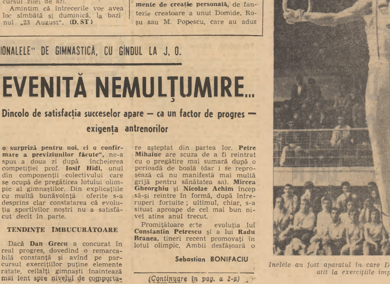
Inelele au fost aparatul în care Dan Grecu și-a dominat toți adversarii, atît la exercițiile impuse, cît și la libere.

Iată, succint, filmul derbyului: (Continuare în pag. 4-a)