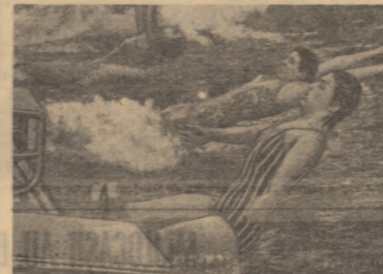
Siarș la proba de 100 m spate (f) în bazinul din Hanovra. În prim plan, însoțitoarea, înaltătoarea maghiară Andreea Gyarmati.

La Hanovra, în cadrul „Turneului celor 6 națiuni” la natatie au fost stabilite altele două noi recorduri europene. În proba de 100 m mixt, înaltătoarea sovietică Nina Petrova a realizat timpul de 2:06,9, iar ștafeta de 4x100 m mixt de Olanda a obținut timpul de 4:39,9. Alte rezultate: MASULIN: 100 m bras — Fankin (U.R.S.S.) 1:05,1; 400 m liber — Samsonov (U.R.S.S.) 4:11,3; 200 m liber — Brinkley (Anglia) 1:57,51; 200 m bras — Fankin (U.R.S.S.) 2:27,46; 100 m butare — Stocklass (R.F.G.) 57,8; 200 m — Cannicham (Anglia) 2:11,8; ștafeta 4x200 m liber — U.R.S.S. 7:32,5; ștafeta 4x100 m liber — U.R.S.S. 3:31,68. FEMININ: 100 m liber — Edith Brightha (Olanda) 59,3; 100 m butare — Heike Nagel (R.F.G.) 1:05,1; 100 m spate — Andreea Gyarmati (Ungaria) 1:07,8. După 19 probe, în clasamentul conduce reprezentativa U.R.S.S. cu 301 puncte, urmată de R. F. a Germaniei — 257 p și Olanda — 246,5 p.