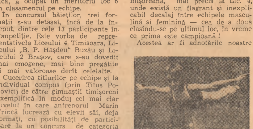
Un nou Titus Popovici (Lic 4 Timișoara), dar în gimnastică!