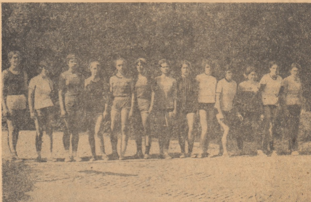
La stadionul Constructorului din Capitală: elevii ai Școlii generale nr. 96

Dacă vrei să afliți pînă unde poate merge improvizația, stimulată de dorința sinceră a unui om de a face treabă, indiferent de condițiile materiale pe care le are la dispoziție, vizitați „baza sportivă” a Școlii generale nr. 124 de pe