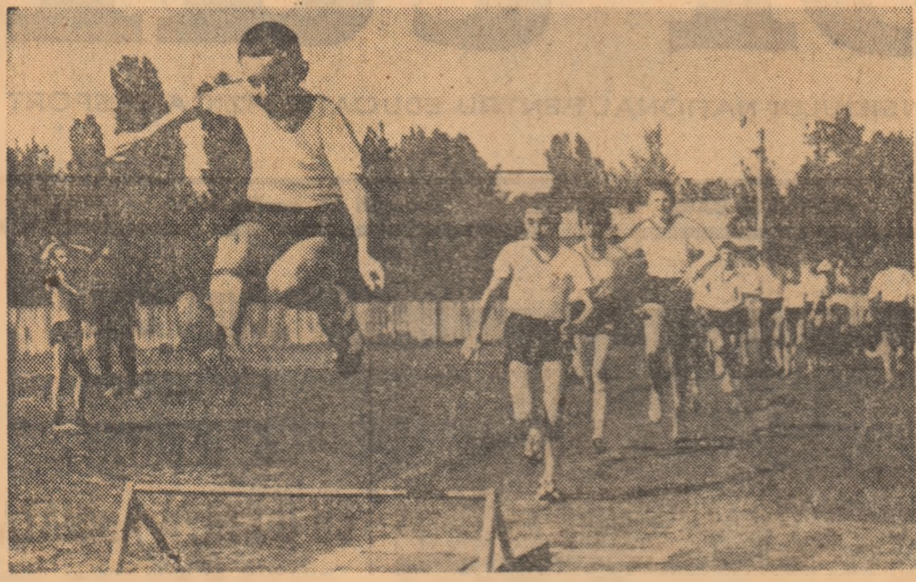
Elevii Școlii profesionale MIU înainte de startul probei de 600 m