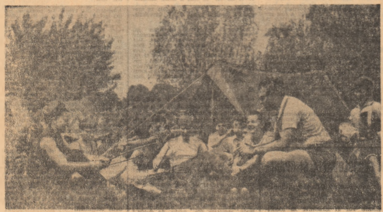
Elevi și profesori din Timișoara și-au înjghebat o tablă de șifrit de săpămîină în apropierea orașului

CAMPINGUL CASCADA: amenajat la 2,5 km de stațiunea balneară Sîlnicului Moldovei; căsuțe și loc de camping.