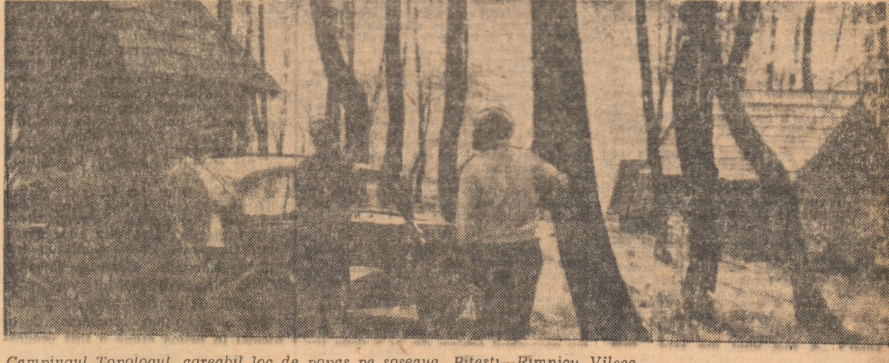
Campingul Topologu, agreabil loc de popas pe șoseaua Pitești-Rîmnicu Vîlșea

SINESTI: pădure, cu un plăcut cadru natural. Camping, restaurant. Acces: DN 2 (cca 31 km).