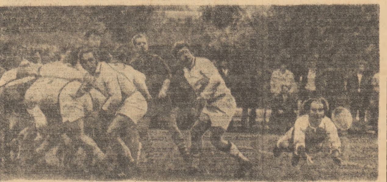
Mingea a fost câștigată de studenți, Roibașu avînd posibilitatea să lanseze un nou atac (Fază din meciul Sportul studentesc — Griveța Roșie).