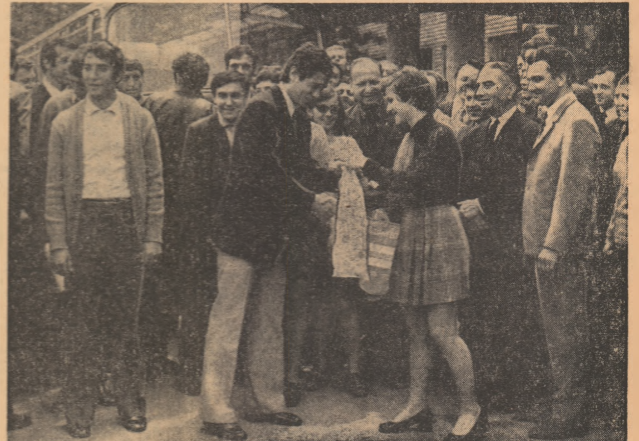
Flori pentru echipa națională de fotbal a României, prin intermediul căpitanului ei, Mircea Lucescu...