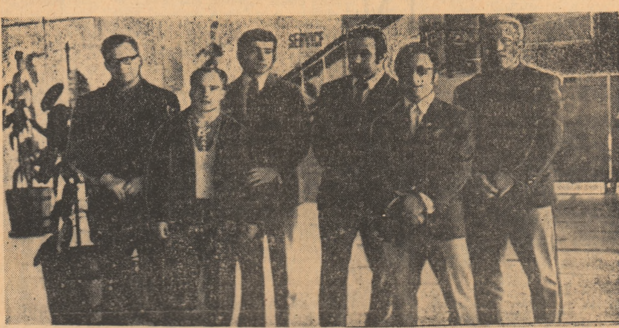
În trecere prin București, în drum spre Constanța, valorosul lot de halterofili din Ungaria

ale Belgiei (5 sportivi), Suediei (8), Norvegiei (4), Albaniei (6), Danemarcei (3) și Angliei (echipă completă). Din lotul suedez se desprind semigreurul Johanson, fost vicecampion mondial, sportiv care a deținut cîteva recorduri mondiale. În acest an el a realizat la triathlon 520 kg. În echipa norvegică am remarcat prezența semigreurului Jensen, care a cucerit, de asemenea, o medalie de argint la C. M. Echipa Angliei, însoțită