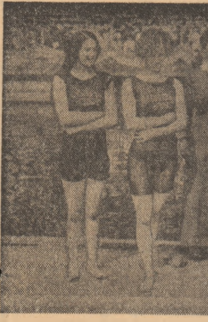
Pudicele înnoțitoare britanice, surprinse de antrenarea lor...