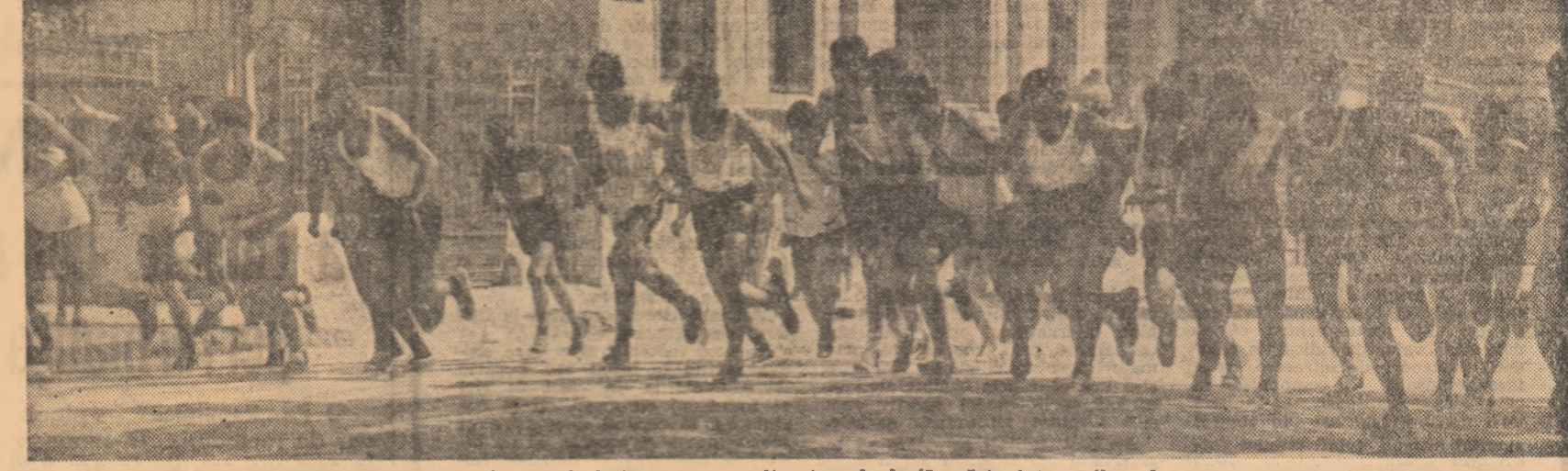
Alergarea a atras întotdeauna sute și sute de tineri. Iată un aspect din timpul desfășurării întrecerilor de cros la care au participat numeroși elevi de pe meleagurile mehedințene.