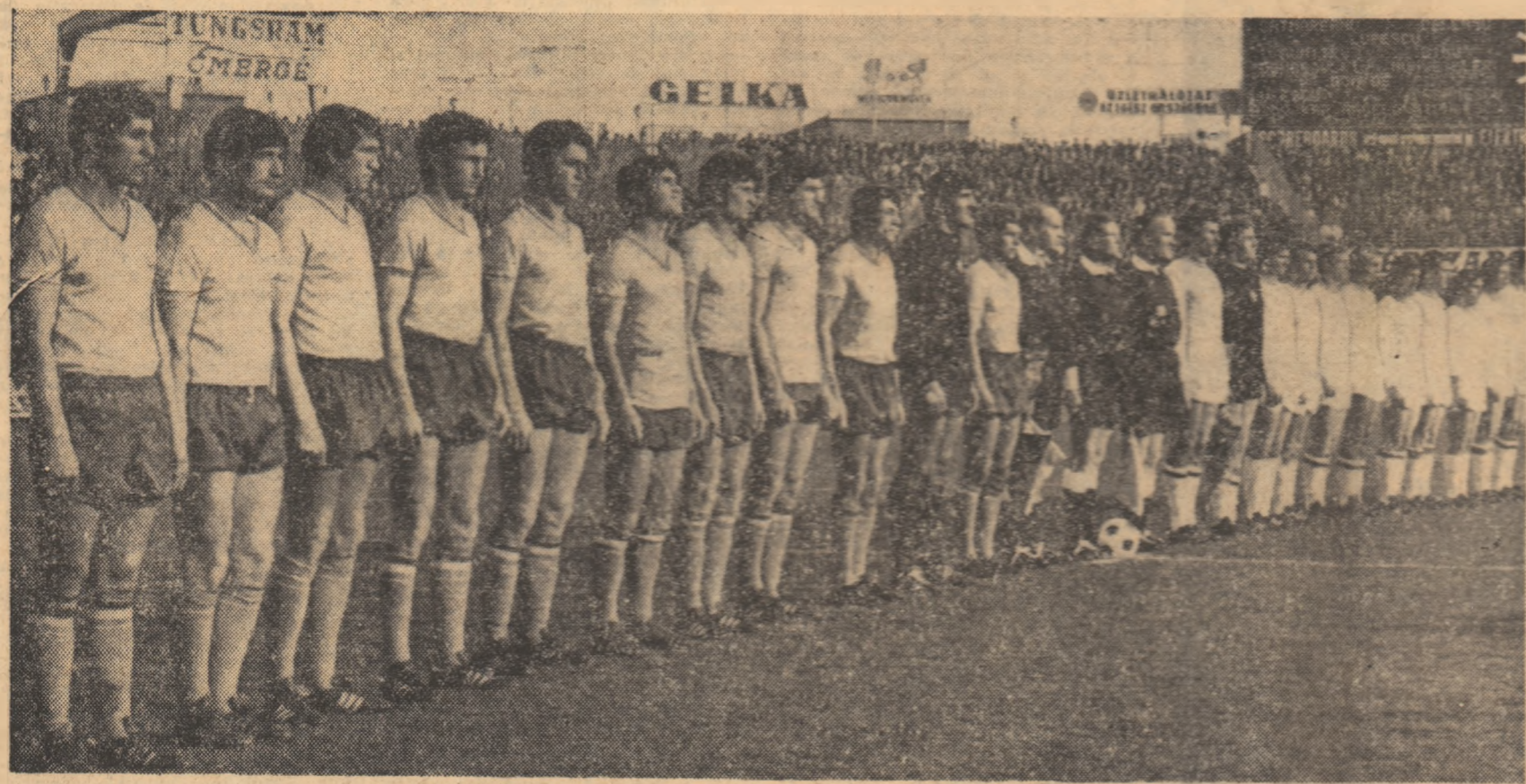
Moment solemn înaintea începerii partidei de pe Neps Stadion, încheiată cu un rezultat (1-1) corectat prima șansă echipei noastre în meciul de astăzi.

Ieri, echipele României și Ungariei și-au încheiat pregătirile prin antrenamentele efectuate la Snagov, și respectiv, pe stadionul pe care va avea loc meciul. În rîndurile de mai jos, vă prezentăm câteva aspecte din cele două tabere care se vor angaja într-o luptă pe care o dorim să ridicăm la nivel tehnic, desfășurată într-o atmosferă de deplină sportivitate.