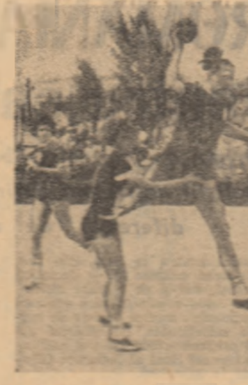
Dispută din Div. I în Giulești, între formațiile Rapid București și Universitatea Cluj...