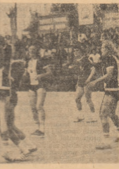
Dispută din Div. I în Giulești, între formațiile Rapid București și Universitatea Cluj...