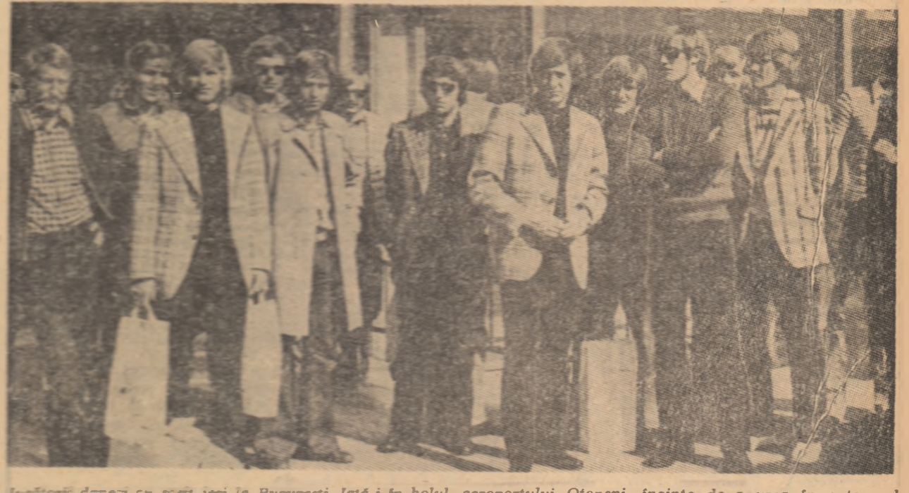
Jucătorii daneci cu soții ieri la București. Iată-i în holul aeroportului Otopeni, înainte de a urca în autocarul care i-a adus în centrul orașului, la hotelul „Ambasador”. (În pagina a III-a, amănunte despre lotul oaspeților într-un scurt interviu cu antrenorul R. Strittich).

Federația noastră de fotbal a acceptat propunerea fotbalistilor italieni pentru o schimbare a întâlnirii amicale ROMÂNIA — ITALIA Prima va avea loc anul acesta, iar a doua în 1973. Anul acesta, meciul cu Italia va avea loc la 17 iunie, la București, în seara de pe „23 August” și va fi organizat de o brigadă de asociații impuglavă.