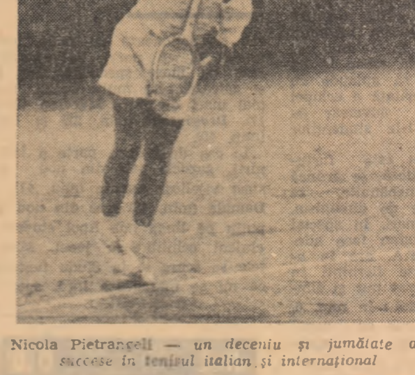
Nicola Pietrangeli — un deceniu și jumătate de succese în tenisul italian și internațional