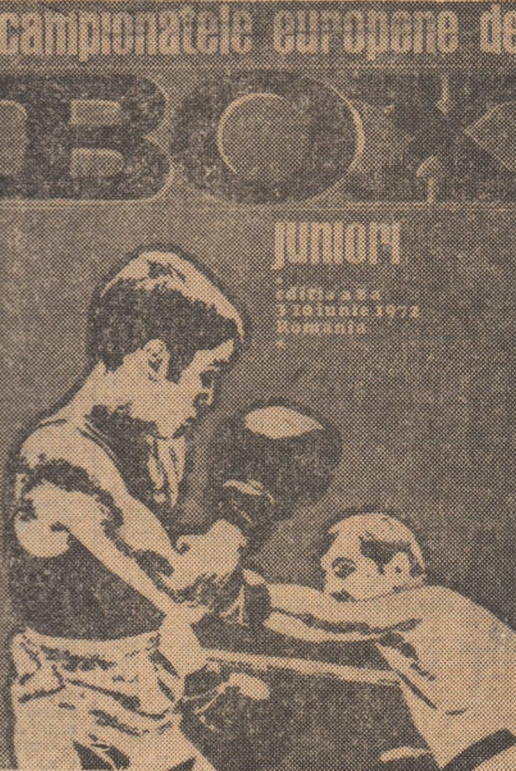
Campionatele europene de box tineret. În luptă doi pugiliști. (Cronicle în pag. 4-4a)

Ringul, folosit pentru prima oară cu ocazia turneului internațional „Centura de Aur”, a fost instalat din nou în incinta patinoarului. Dreptunghiul de beton a fost acoperit cu scările ce vor asigura condiții optime de vizibilitate spectatorilor. Băncile din tribune au fost reamenajate, astfel ca un număr de aproape 8000 de spectatori vor putea urmări întrecerile tinerilor pugiliști. Sase vestiare amenajate cu mese pentru masaj vor sta la dispoziția participanților la europenele de la București. Tabloul electronic ce va indica scurgerea timpului, numele și țara) concurenților, precum și deciziile acordate de cei cinci arbitri judecătorești a fost verificat și se află în perfectă stare. În concluzie, gazele campionatelor europene de box rezervate tineretului sînt complet pregătite. Hotelul „23 August” rezervat pugiliștilor participanți la aceste întreceri strălucește de curățenie și își așteaptă noii oaspeți. În incinta micului complex sportiv au fost instalate patru ringuri de