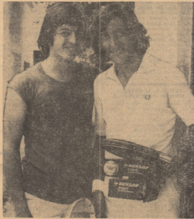
Adriano Panatta și Ilie Năstase, primele rachete ale celor două echipe.

Nu știm dacă organizatorii Întîlnirii de tenis România — Italia se gândesc, pentru viitor, la antrenamente cu portile închise, dar făcînd din nou la arena Progresul, am constatat că, de pe acum, eleva sute de bucureșteni au și gustat primul aperitiv din bogatul festin ce le rezervă finele acestei săptămîni. „Am fost marele meci au evoluat în întîlnirea de ieri dimineață în fața unor tribune destul de bine populate, ba am auzit chiar cîteva discrete aplauze din partea unor spectatori prea nerăbdători, iar faptul că Ilie Năstase se află într-o vervă deosebită, sau că Adriano Panatta a purtat un tricou roșu aprins, pare să fi constituit evenimentele zilei, în bătrînul parc din strada dr. Stălcovici.