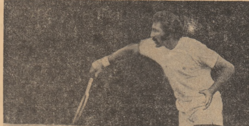
Ion Tiriac la antrenamentul de ieri.