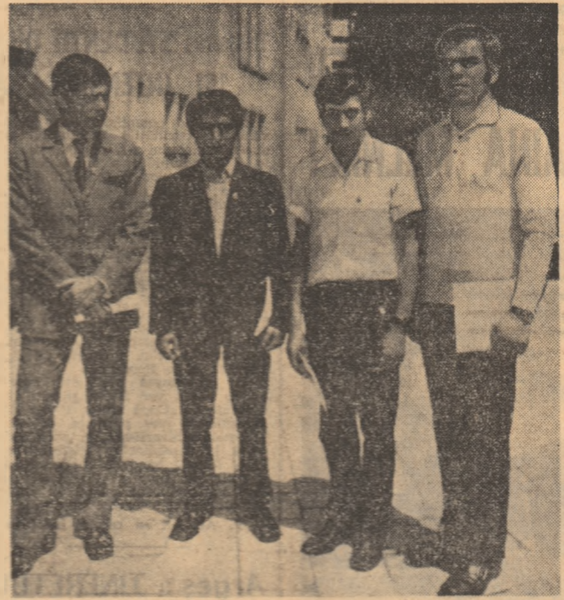
Cei 4 proaspeți campioni europeni de tineret...