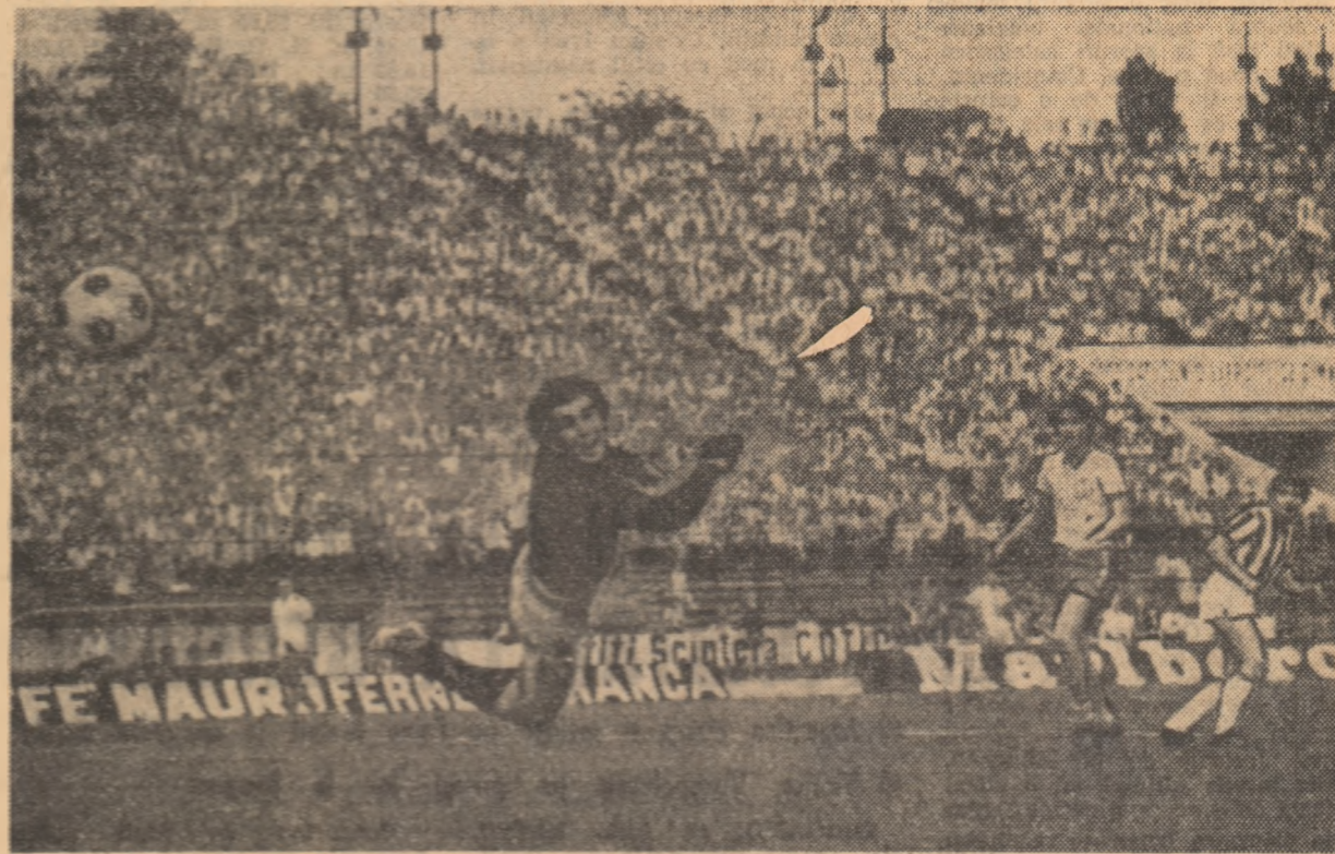
Tamașiu înscrie golul al treilea pentru echipa de juniori a Bucureștiului. În poftida spectaculosului, său plonjon, portarul polonez Ciesielski este învins.