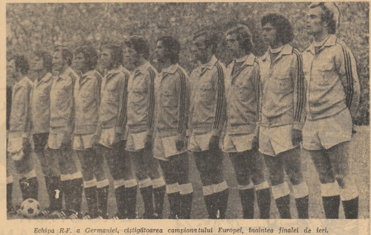
Echipa R.F. a Germaniei, câștigătoare a campionatului Europei, înaintea finalei de ieri.