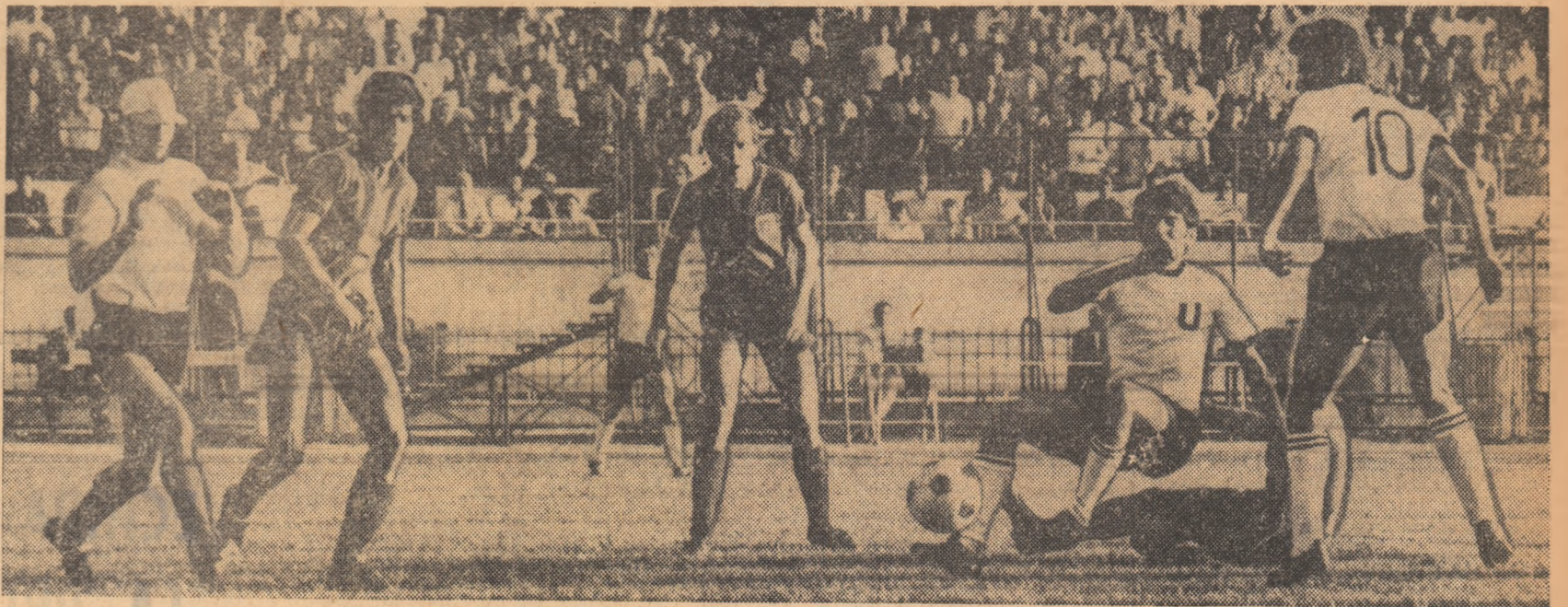
Universitarii clujeni în luptă cu apărarea Stelei, într-unul din jocurile — întodeauna interesante între acești doi adversari — disputate la București. Ce va fi disează? Pe Stadionul 23 August, meciul începe la ora 20. Avem toate motivele să credem că va fi o partidă interesantă!

Nu se lasă mai prejos nici cei din județul Caraș-Severin. Ei vor da în acest an 175 de milioane lei în plus