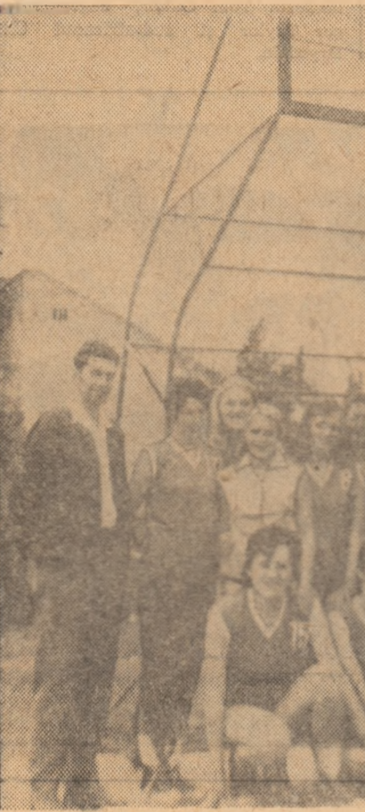
Voința Tg. Mureș, noua promovată în divizia A.