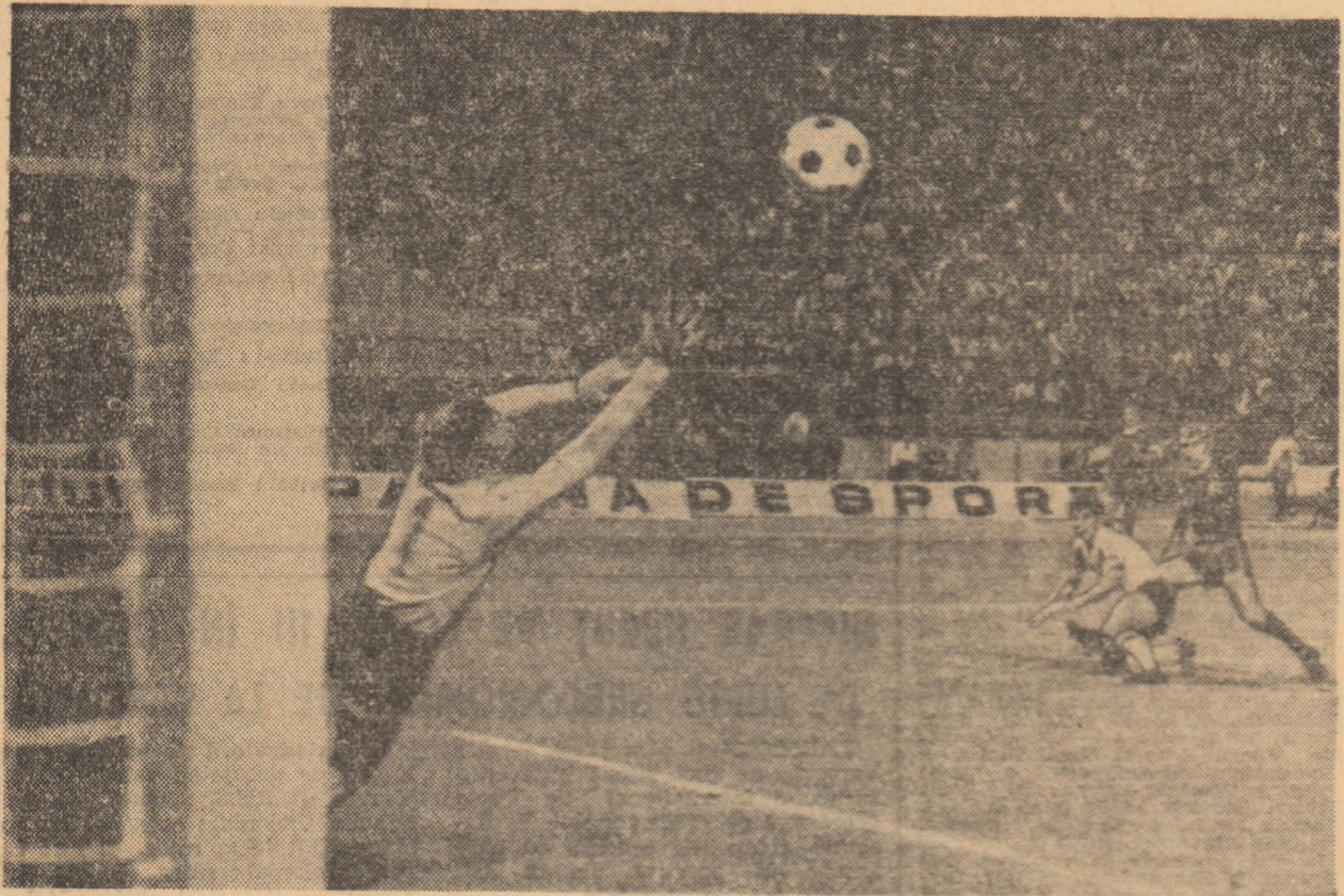
Minutul 27 al finalei: Neagu șutează năpraznic și Suciu este nevoit să se recunoască învins pentru a doua oară.

(Urmare din pag. 1) făcut mai rapid, mai simplu și mai oportun, în ceea ce-l privește pe bucurăseni, reușitele acestora