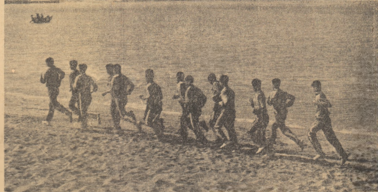
R. P. CHINEZA, un imens rezervor sportiv. Atleții din provincia Shantung cunosc secretul performanței. Iată-i, la ivirea zorilor, într-o hînică „promenadă” pe nisipul binefăcător al plajei Tsingtao.