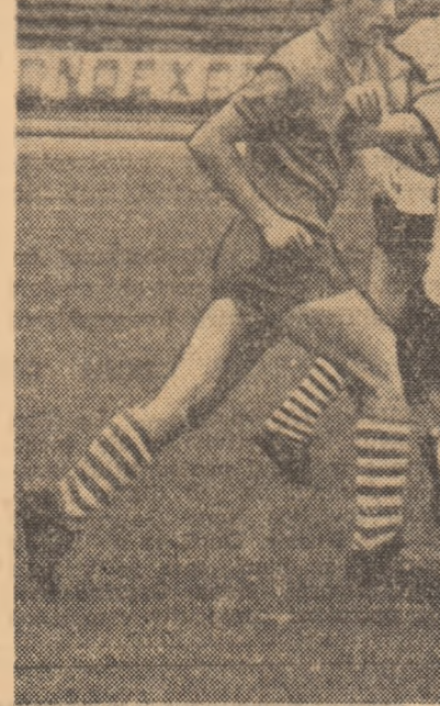
Clujanul Păuna, talonat de Custof, mai are două obstacole pînă la poarta adversă: Mîndruț (nr. 6) și Banciu.