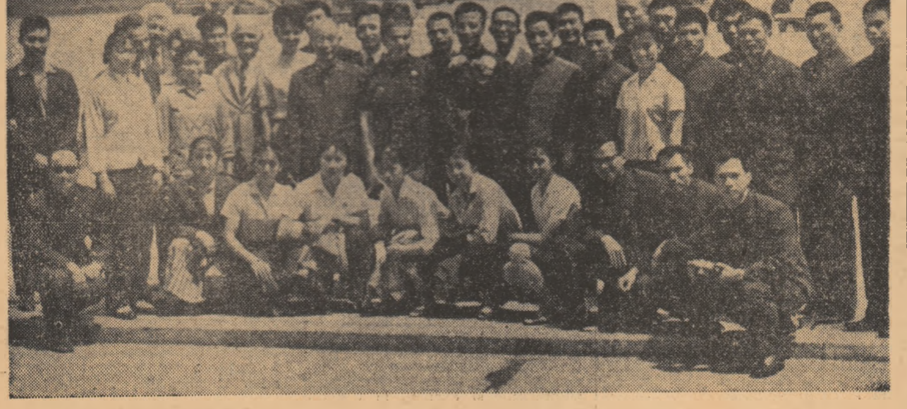
Aspect de la sosirea oaspeților la aeroportul Otopeni.

naștii și gimnastele din R.P. Chineze. Este interesant de reținut că, în Iugoslavia, unde s-au aflat timp de mai multe zile, echipele R.P. Chineze s-au antrenat în comun cu gimnastele iugoslave, iar în meciul amical organizat între reprezentativele celor două țări, gimnastele chineze au câștigat atât la feminin cît și la masculin. Întîlnirile amicale România — R.P. Chineze sînt programate sîmbătă și duminică la Brașov, cu exerciții liber alese.