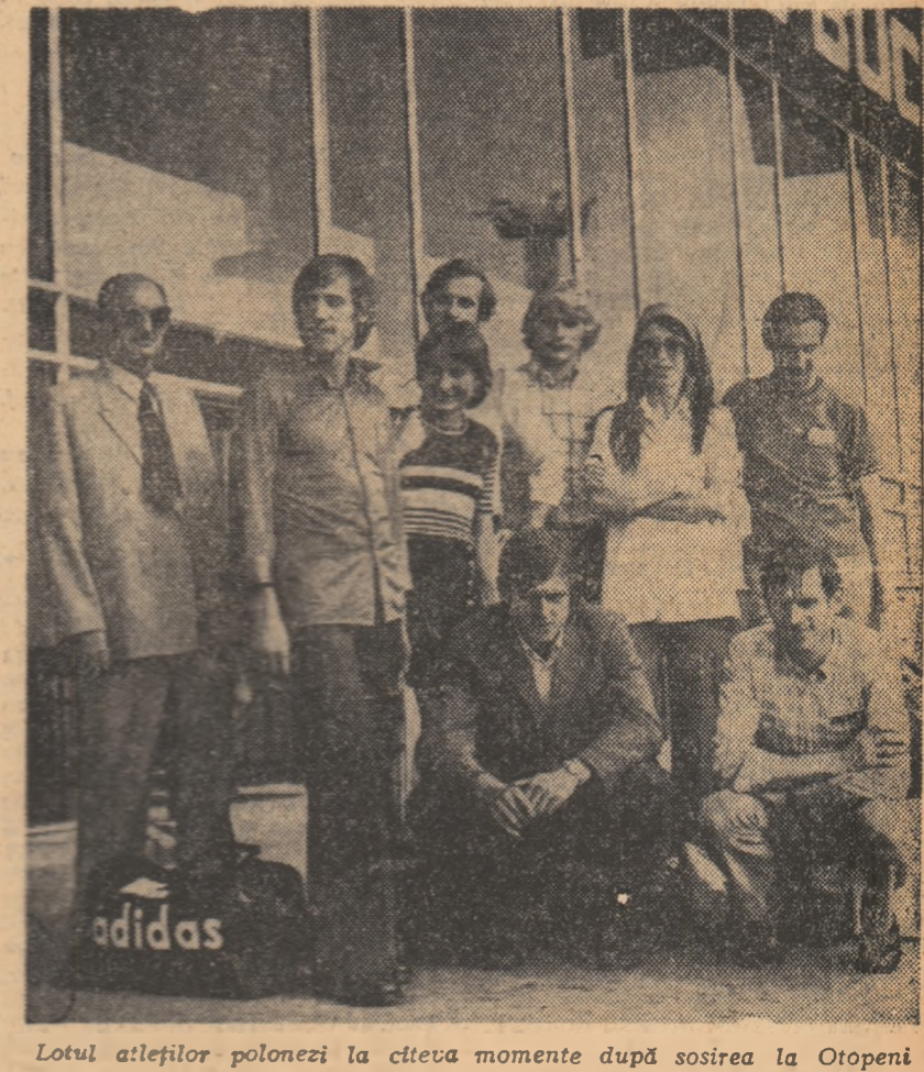
Lotul atletilor polonezi la cîteva momente după sosirea la Otopeni.