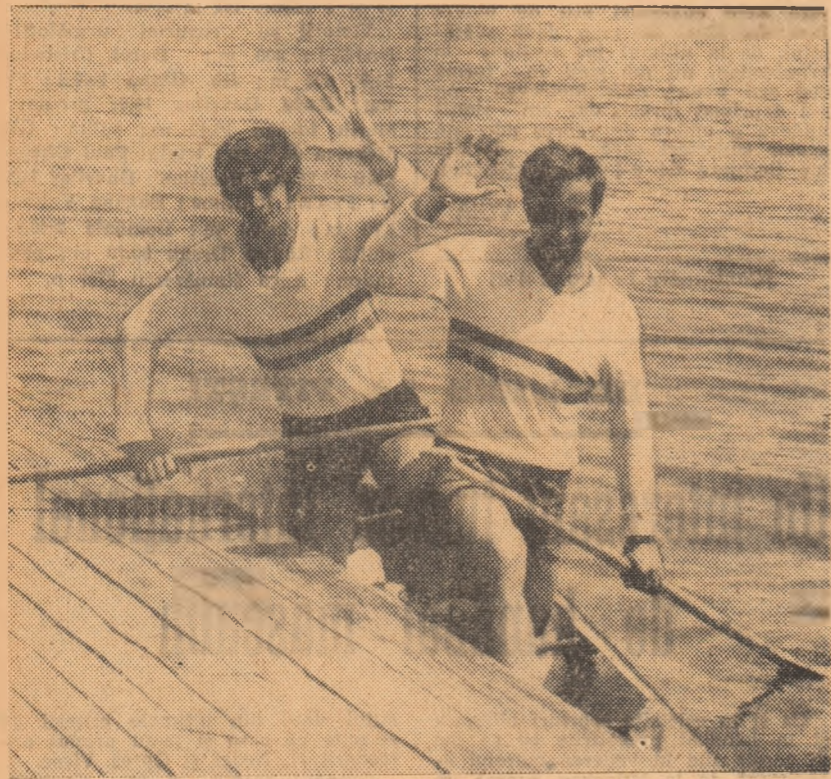
Serghei Covaliov — Ivan Patzaichin, campionii olimpici de la Ciudad de Mexico.