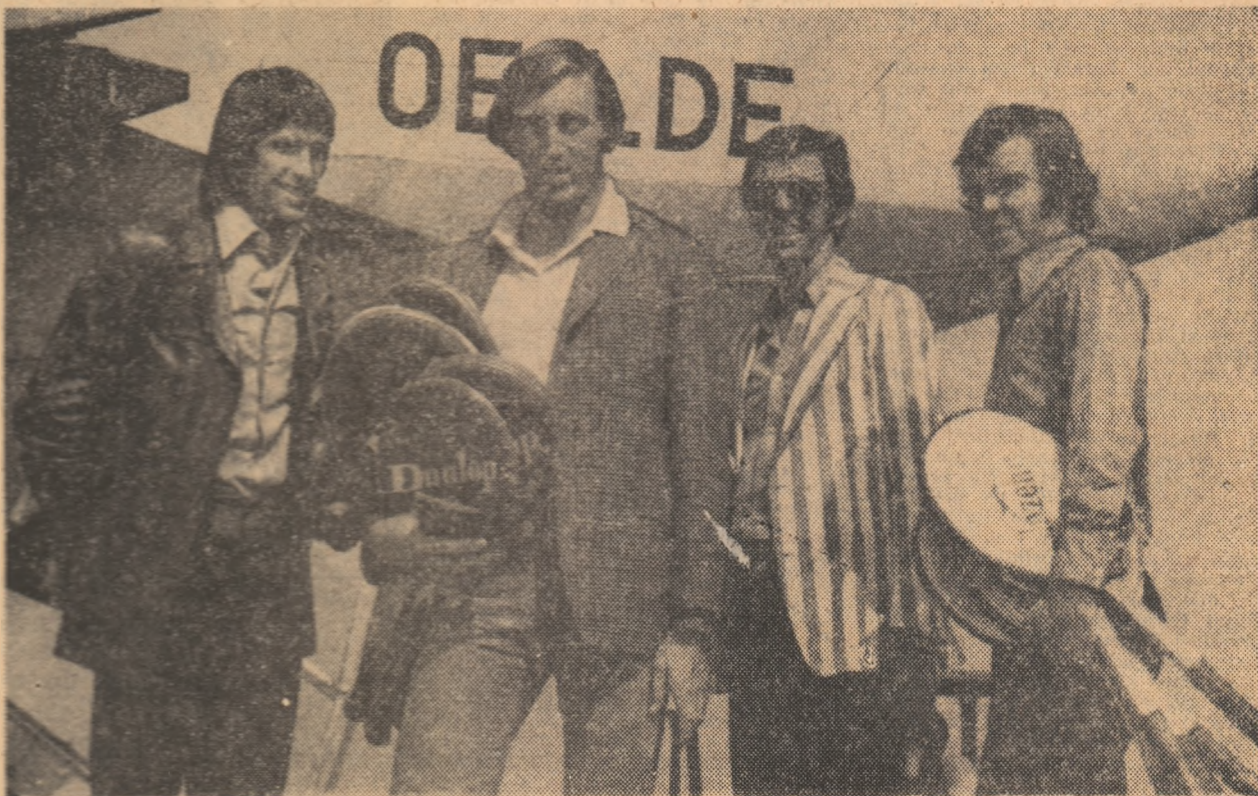
Echipa Australiei la coborirea din avion pe aeroportul internațional Otopeni

Prima zi de august marchează intrarea efectivă a sportivilor noștri în ultima linie dintr-o competiție olimpică.