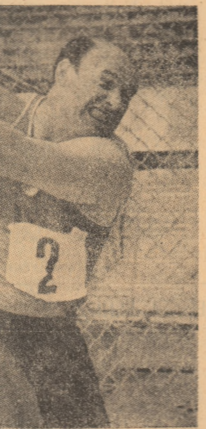
cel mai bun, deși nu deține recordul mondial sau european. În acest sezon, însă, „Mirișii” Bondarciuk s-a dovedit imbatibil, iar marele majoritate a aruncătorilor sale au merseri în jurul cifrei de 75 m. Ultimele trei evoluții ale sale — 75,75 m, 75,90 m, 75,65 m — probabil o vor înlocui conștient la un nivel foarte ridicat și îl desemnează drept cel mai autorizat candidat la medalia olimpică de aur, în palmarea și siguranță trei zile de concurs al U.R.S.S. (1968, 1970, 1972) și a țării de campion europene (1969, 1970, 1972).