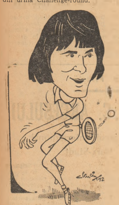
ION TIRIAC Caricaturi de AL. CLENCIU

curând posedau un record al competiției, câștigând „Salutera“ de 22 de ori. Record înscris de americani, la ultima ediție, când învingeau la limită echipa noastră în cel din urmă Challenge-round.