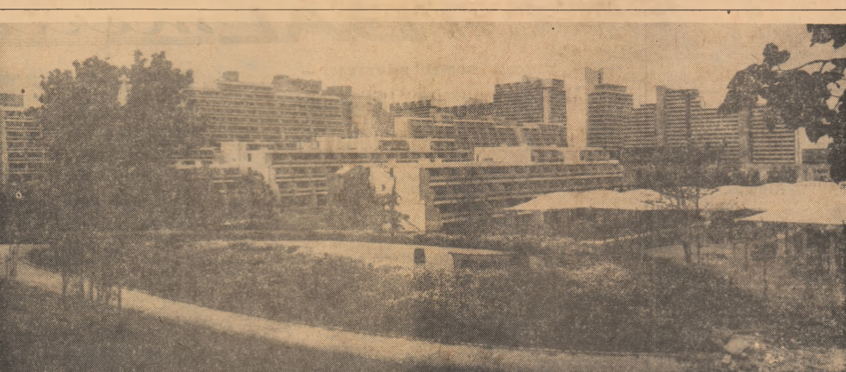
PRIMI OASPEȚI ÎN SATUL OLIMPIC. Aci, în blocurile și bungalourile Satului olimpic de la Oberwiesenthal, au sosit primii dintre cei peste 10.000 de sportivi participanți la Jocurile Olimpice

Astăzi, au loc următoarele partide: U.R.S.S. - România I (la Lugoj); Cuba - Polonia (Timisoara); Bulgaria - Ungaria (Timisoara); România II - R.P.D. Coreana (Sibiu); Polua - Hare,