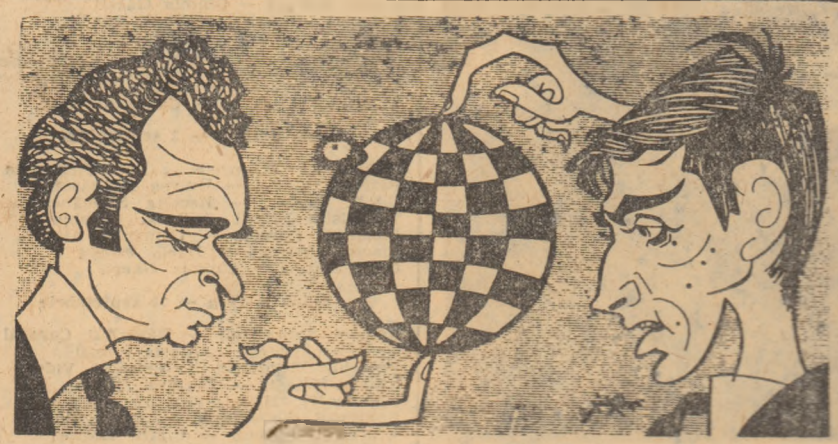
Cei doi „poli” ai șahului mondial văzuți de caricaturistul bulgar Noncev.