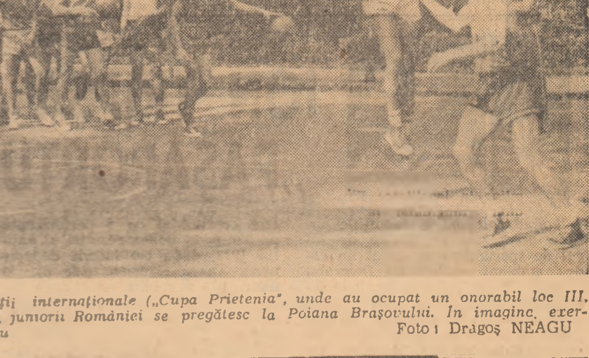
Intre cele două importante competiții internaționale „Cupa Prietenia”, unde au ocupat un onorabil loc III, și campionatul balcanic de la Ploiești, juniorii României se pregătesc la Poiana Brașovului.