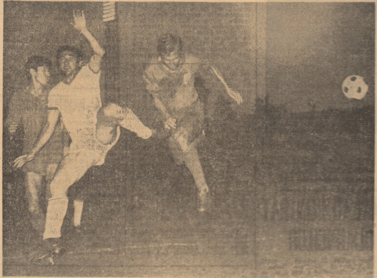
Secență din finala „Cupai Municipiului București”, echipa a V-a, care a recentat echipei Steaua, învingătoare asupra Politehnicii în fața a 4-1.

Dinamo, cu a sa jumătate de efectiv din echipa națională — Dinu, Deleanu, Rădu Nunweiler, Luceșcu, Dumitrache, fost și dorit vir al reprezentativei noastre — este așteptat cu legitim interes, spectatorul urmînd în evoluția sa descifrarea viitoarelor performanțe nu numai ale multiplei campioane, ci și ale titularilor care ne vor reprezenta în preliminariile viitorului campionat mondial. La rîndul său, Steaua se prezintă în acest debut de sezon întărită cu câteva elemente care nu mai au nevoie de o recomandare specială: Dumitru — titular al echipei naționale, Voinea — fost titular în atacul echipei reprezentative, golgeter a numeroase campionate, Iordache — o mare promisiune a fot-